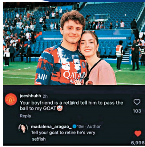
●尼維斯女友遭C朗狂迷網絡攻擊。網上圖片