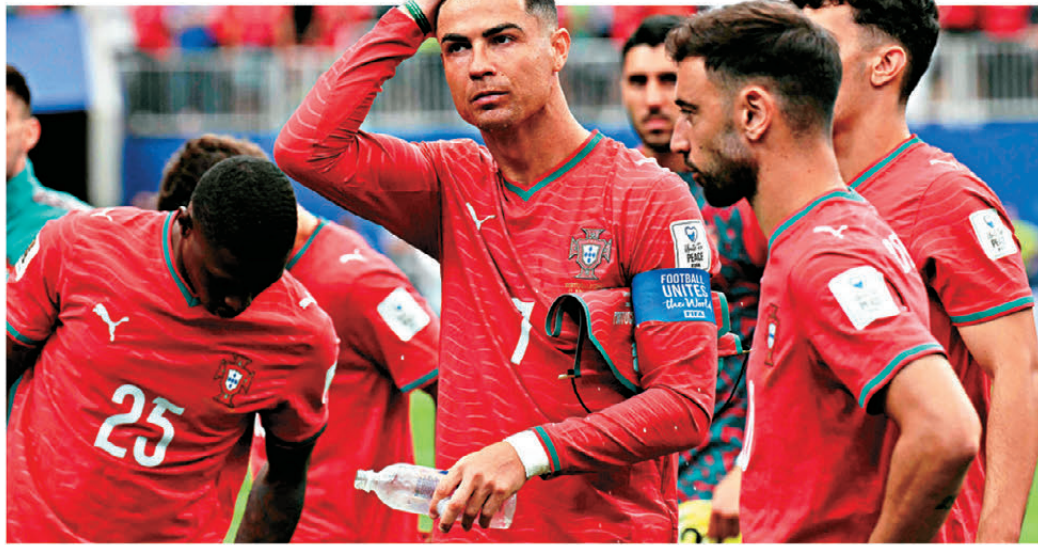
●C朗拿度首仗「隱形」，賽後引起外界熱議。