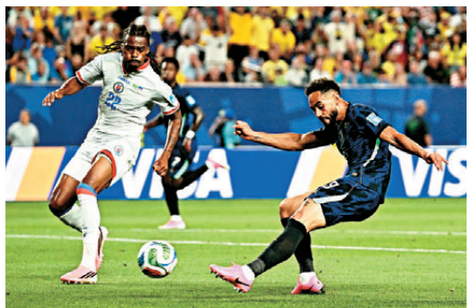
●馬菲奧斯根夏(右)連入兩球，助巴西輕取海地全取三分。

香港文匯報訊(記者 葉詩敏)世界盃C組次輪賽事，首戰失利的「森巴兵團」巴西移師費城硬撼海地。巴西憑藉曼聯前鋒馬菲奧斯根夏梅開二度，加上雲尼奧斯祖利亞連連兩場建功，最終以3:0輕取海地，順