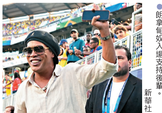
●朗拿甸奴入場支持後輩。

然而狂攻之下亦傳出噩耗，翼鋒拉芬夏於40分鐘傷出，由19歲新星拉恩域陀入替。幸而傷兵未有打亂節奏，補時階段雲尼奧斯單刀破網，巴西半場遙遙領先三球。易邊後，海地雖有列卡度阿迪頭槌險些「破蛋」，但被艾利臣比加化解，最終巴西維持3:0勝局。賽後巴西兩戰積四分升上榜首，安察洛堤表示尼馬可於