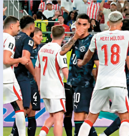
●米基爾阿米朗(右二)「掩口」向對手耳語，觸犯世界盃新例。