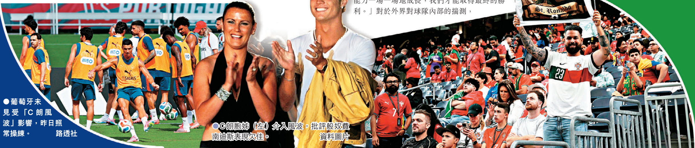
●葡萄牙未見受「C朗風波」影響，昨日照常操練。