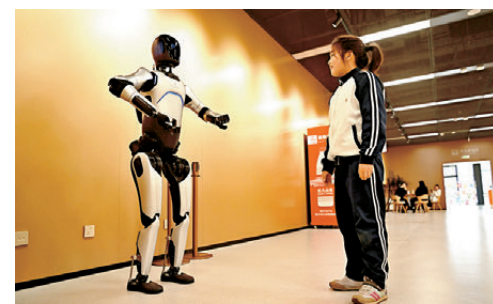
●在雄安圖書館，一名小朋友與機器人「館員」互動。資料圖片