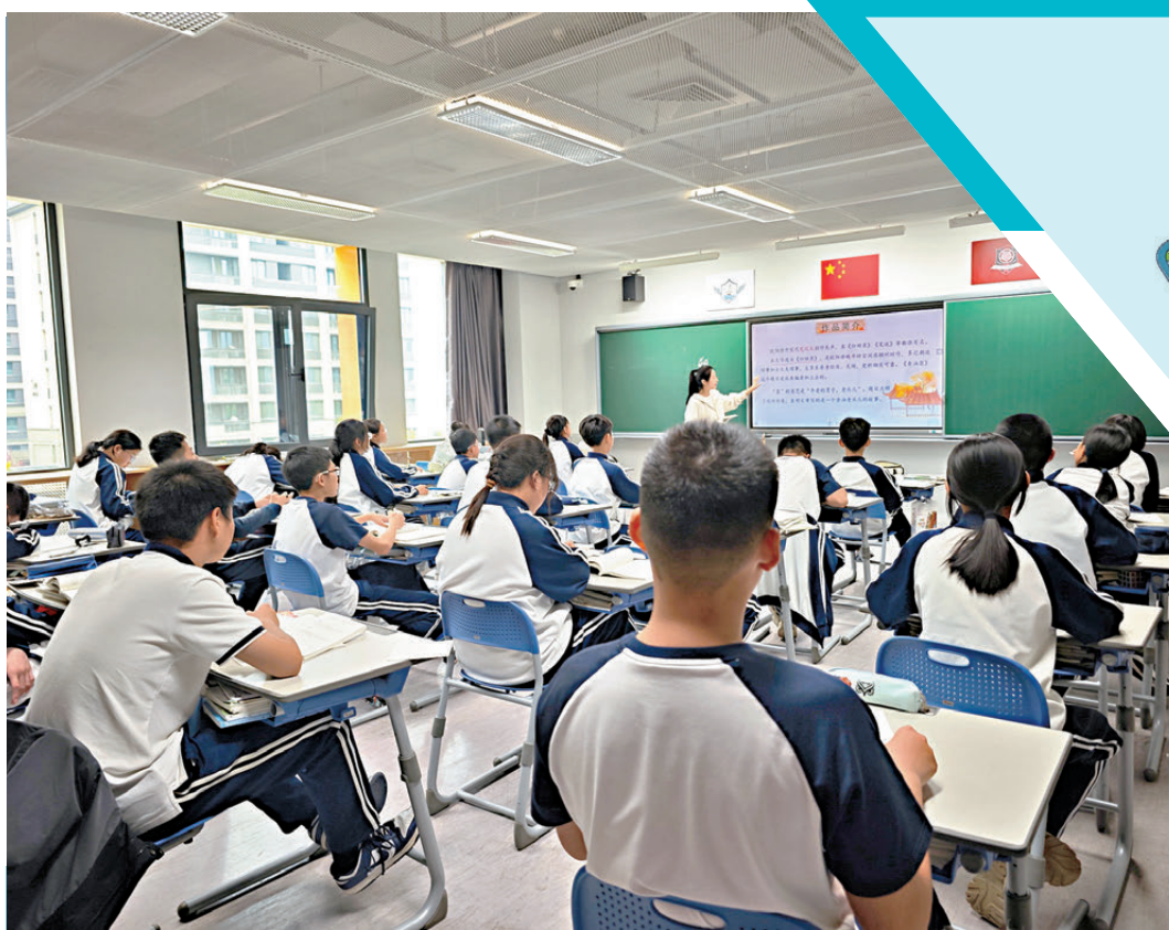
●北京四中雄安校區初一(2)班學生在上語文課。