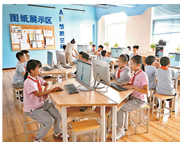
●中關村第三小學雄安校區3D打印社團的同學們在軟件上設計火箭模型。資料圖片

近年來，雄安新區與北京市、天津市簽訂多項教育發展合作協議，教育資源共享和協同發展成效明顯。據介紹，隨着一系列智能平台與應用工具落地，北京與雄安兩地中小學還將共享AI通識課、智慧體育等優質教育資源。