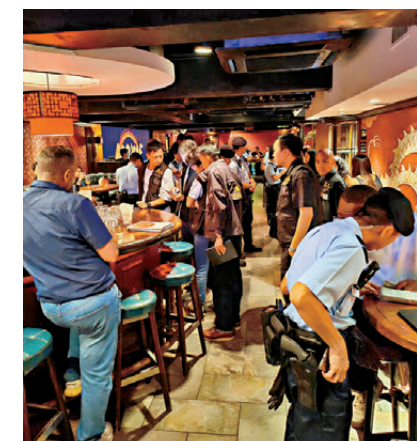
●警方由6月17至19日在全港各區展開代號「逸影」的反罪惡及反三合會行動。

被捕116人包括25名本地男子、12名本地女子、3名內地男子、3名內地女子、27名非華裔男子、2名非華裔女子、一名非華裔男童、26名外籍男子及17名外籍女子，年齡介乎16歲至66歲，涉嫌「販運危險藥