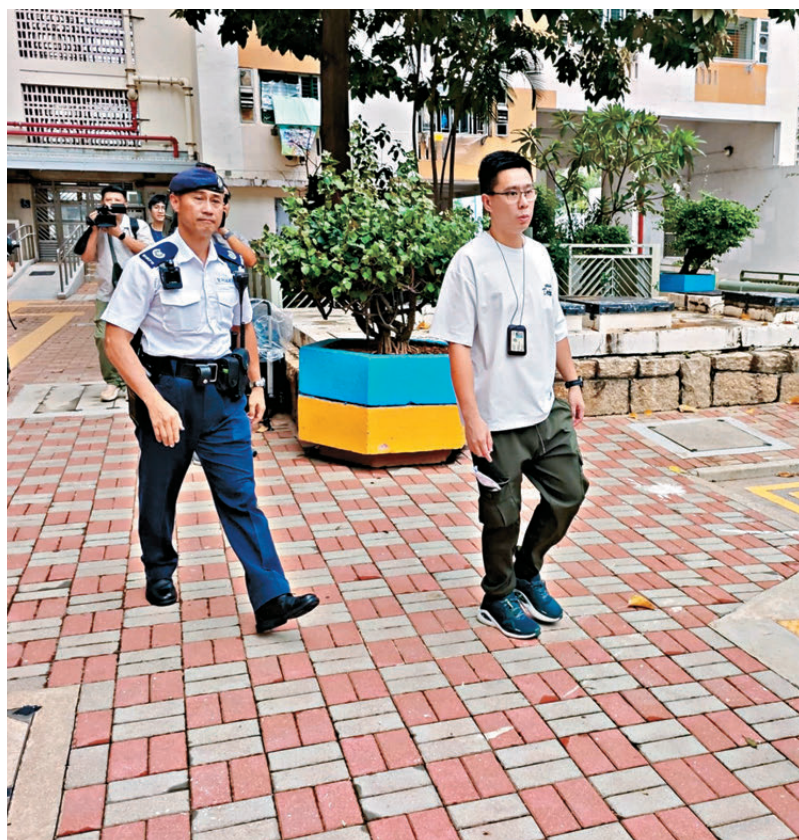
●前日案發後，重案組探員到荔景邨命案現場調查。 資料圖片

同時，特區政府會以多管齊下的方式增加本港院舍宿位供應，包括恒常化私人發展商參建安老院計劃等。