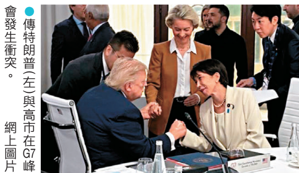
●傳特朗普(左)與高市在G7峰會發生衝突。