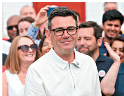
●伯納姆在英格蘭梅克菲爾德選區國會補選中大勝。

香港文匯報訊 英國《衛報》19日披露，多名內閣大臣已向英國首相斯塔默下達「最後通牒」，敦促他制定離職時間表，否則其屬執政工黨的其他閣員。可能會在本周內閣會議上採取進一步逼宮行動。此次逼宮的導火線是工黨候選人、大曼徹斯特市長伯納姆，在日前的英格蘭梅克菲爾德選區國會補選中大勝，得以重返國會。他曾在候選人辯論中表示，他勝選後將尋求加入任何挑戰斯塔默黨魁地位的活動。斯塔默19日致電內閣成員，表示「若發生黨魁競選，他將參選」，但閣員普遍持悲觀看法，運輸大臣亞歷山大在電話會議中表達了擔憂，能源大臣利班德及司法大臣馬哈德此前已建議斯塔默設定離職時間表。一名內閣消息人士稱：「每個人都認為斯塔默結束了，且希望這是一次體面、有序的退出。」