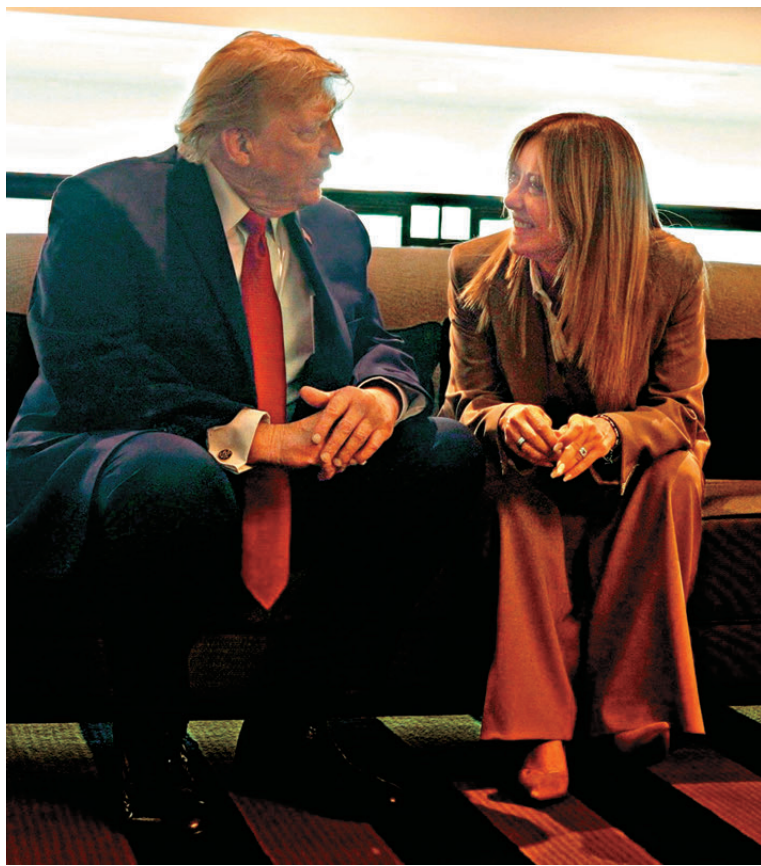
●特朗普稱「梅洛尼乞求合照」。圖為兩人於峰會最後一日會面。

梅洛尼曾是特朗普的堅定支持者，也是唯一出席特朗普去年就職典禮的歐洲領導人，曾被認為是歐美之間的橋樑。不過雙方近來就伊朗戰事的分歧明顯，梅洛尼拒絕美軍使用意國境內基地進行軍事行動，特朗普因此指責意大利未在戰爭中提供幫助。今年4月，梅洛尼還為天主教教宗利奧十四世的反戰立場辯護，特朗普隨即調轉槍口抨擊梅洛尼，他在接受意大利《晚郵報》訪問時表示，「我對梅洛尼感到震驚。我原以為她很有勇氣，但我錯了。」