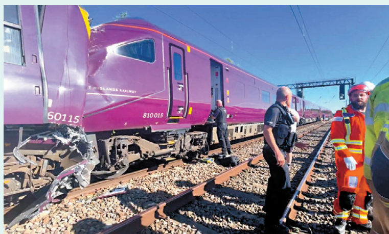
●兩列從英格蘭中部開往倫敦的客運火車發生相撞。

香港文匯報訊 英國發生嚴重火車相撞事故，兩列從英格蘭中部開往首都倫敦的客運火車，19日下午在倫敦以北約90公里處相撞，一名火車司機當場死亡，近90名乘客