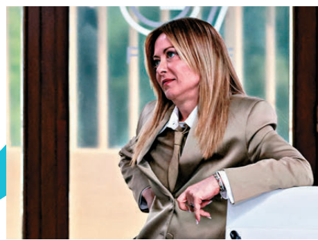
▲早前網上流傳峰會工作午餐畫面，梅洛尼被指在特朗普面前態度輕鬆。