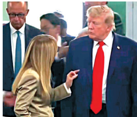
●梅洛尼更被影到對特朗普「指指點點」。網上圖片