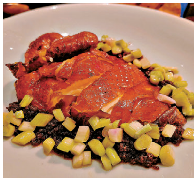
櫻醬葱油脆皮平原雞