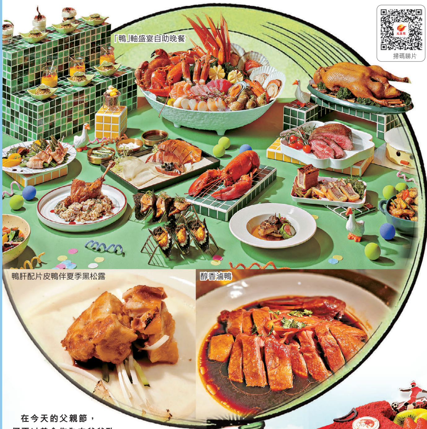
「鴨」軸盛宴自助晚餐