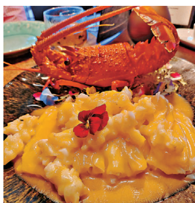
雕皇驕龍披皺紗——醉香花雕炒龍蝦球伴廣式蒸腸粉