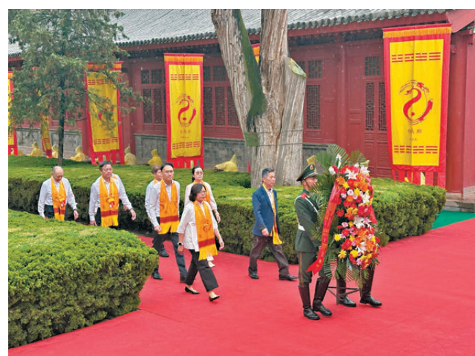
●麥美娟昨日在甘肅省天水市代表香港特別行政區政府出席2026（丙午）年公祭伏羲大典。

香港文匯報訊（記者 郭濤 甘肅報導）兩岸三地共祭始祖，華夏兒女同根同源。2026（丙午）年公祭中華人文始祖伏羲大典昨日上午9時50分在「羲皇故里」甘肅省天水市隆重舉行。本屆大典由國務院港澳事務辦公室、國務院台灣事務辦公室、甘肅省人民政府共同主辦，天水市人民政府承辦，以「廣續文脈凝聚力量，傳承智慧勵後人」為主題。香港特區政府民政及青年事務局長麥美娟率領香港代表團專程赴隴出席。同時，今年也是海峽兩岸第十三次共祭伏羲，台灣地區祭祀地點設於新北市先嗇宮。