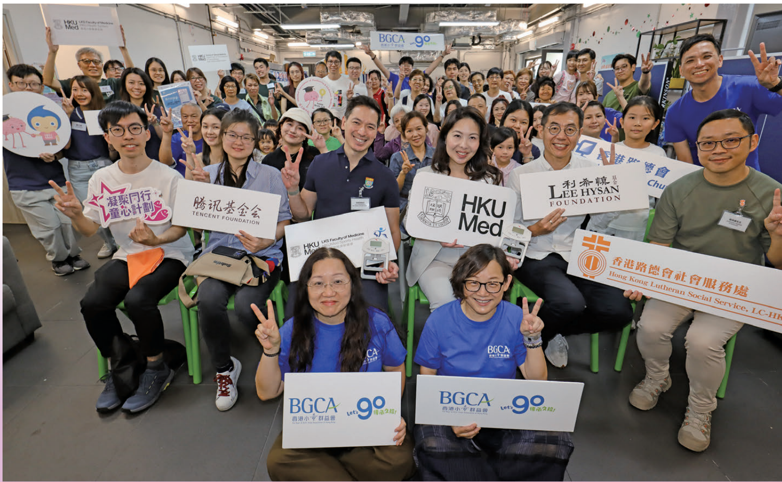
●兩所過渡性房屋街坊和義工齊聚一堂，通過活動促進鄰里聯繫。

計劃採用分層護理模式，將專業服務延伸至社區最前線，以「家庭健康支援站」為據點，服務對象涵蓋由嬰幼兒至長者的跨代家庭成員，提供醫療服務、家庭及社交活動、身心靈服務，以及社工專業諮詢與輔導等多元化支援。其間，服務團隊致力透過跨專業醫社協作與中西醫結合的模式，及早識別有需要的居民，為他們築起一道由預防、介入到持續支援的完整防護網。