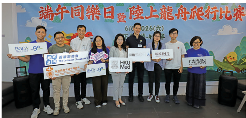
●利希慎基金、騰訊基金會、香港大學李嘉誠醫學院、香港小童群益會及香港路德會代表於活動上合照。