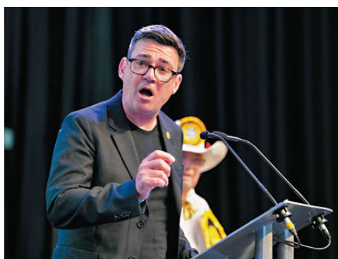
●工黨高層人士質疑伯納姆能否團結工黨重振聲譽。資料圖片

路透社指出，若斯塔默辭職或被罷免，意味着英國近10年將迎來第七位首相，這是英國近兩個世紀以來最高的首相更迭頻率，凸顯英國民眾對歷屆政府未能改善公共服務等問題的憤怒。斯塔默19日則表示，他將應對任何對領導權的挑戰，敦促工黨不要因內訌而分裂。