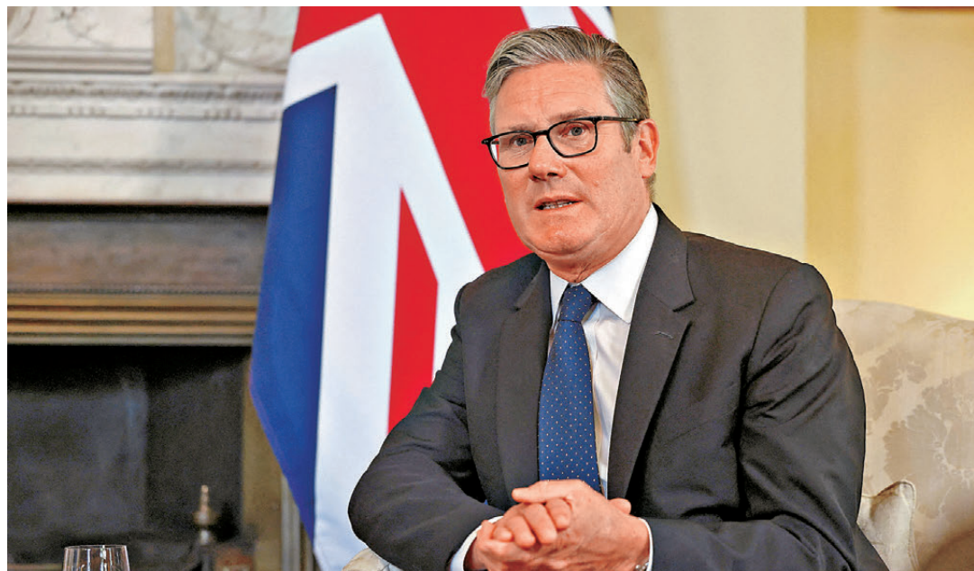
●匿名工黨高層人士形容，斯塔默似乎已接受必須辭職的現實。資料圖片

距離斯塔默帶領工黨壓倒性勝出大選僅過去不到兩年，工黨政府如今在經濟和外交領域並無建樹，反而因財政補貼和稅收等問題引起選民不滿，斯塔默被認為能吸引選民的政治形象已消失殆盡。分析指出，工黨內部普遍認為若與伯納姆競爭黨魁，斯塔默必敗無疑。有消息人士稱，愈