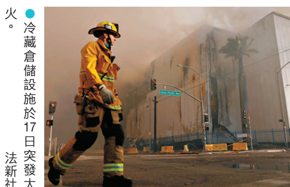
●冷藏倉儲設施於17日突發大火。

香港文匯報訊 美國洛杉磯市一處大型商業倉儲設施火災持續焚燒數日，並產生大量刺激性煙霧，洛杉磯市長巴斯20日宣布該市進入緊急狀態。