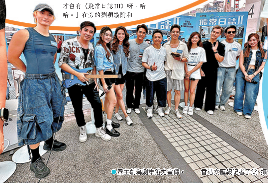
●眾主創為劇集落力宣傳。