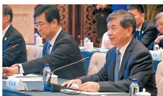
●周祖翼表示，站在國家「十五五」新起點上，閩港合作迎來全新發展機遇。

截至今年5月，福建累計引進港資企業3.3萬家，實際利用港資累計1,051億美元，佔全省外資65.3%；全省73家企業在港交所上市，去年以來新增10家。今年1月至5月，閩港進出口貿易總額同比增長32.4%，全省50所高校具備招收香港學生