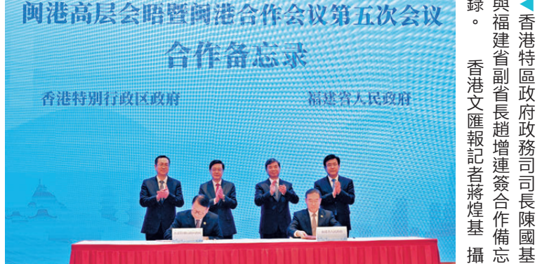
▲香港特區政府政務司司長陳國基與福建省副省長趙增連簽署合作備忘錄。