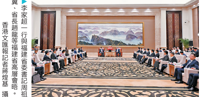
▲李家超一行與福建省委書記周祖翼、省長趙龍等福建省高層會晤。