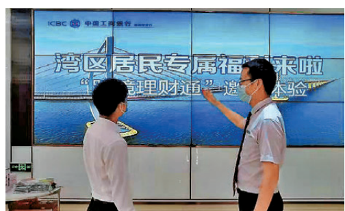
●大灣區經濟持續穩定增長及居民財富的上升，是香港財富管理突破地域限制的最佳契機。

鄂志寰同時強調，要發揮金融科技的創新優勢，在各地監管合規的前提下，加快大數據、人工智能、虛擬實境、遠程生物認證、跨境流動支付等技術創新及應用，提高客戶服務體驗，打造香港財富管理專業優勢新亮點。