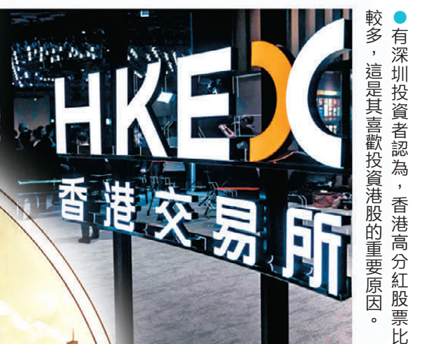
●有深圳投資者認為，香港高分紅股票比較多，這是其喜歡投資港股的重要原因。