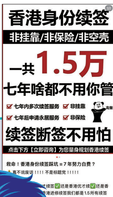
▲大量不法中介的虛假宣傳充斥小紅書，申請人隨時誤墮法網。