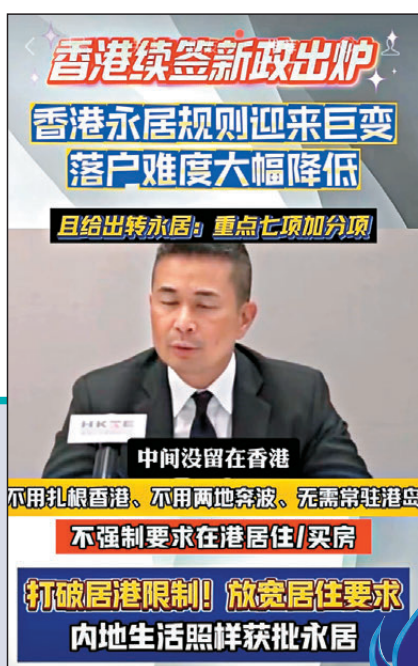
▲中介任意截取香港新聞圖片，自行配上文字，製造假新聞。

他指出，近年愈來愈多內地人透過該兩項計劃來港，他們普遍受過高等教育，但人生路不熟，亦不熟悉香港法例。尤其是在港創業的人才要留意《僱傭條例》中有關最低工資、工作時間與支付工資時間等規定，避免觸法例。