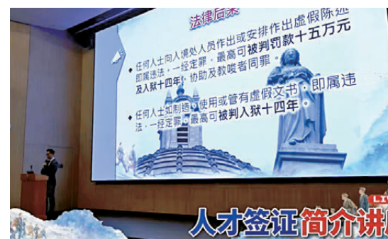
●入境處在「人才簽證簡介講座」現場講解使用或提供虛假文件等違法行為的法律後果。

陳勇最後補充，香港目前已成功吸引超過20萬人才來港，絕大部分個案均順利發展並對香港作出貢獻，小部分中介亂象並不會影響整體計劃的公信力。政府將繼續加強宣傳教育及兩地執法合作，讓更多符合資格的人士安心透過正規渠道申請，實現個人和家庭的長遠發展。