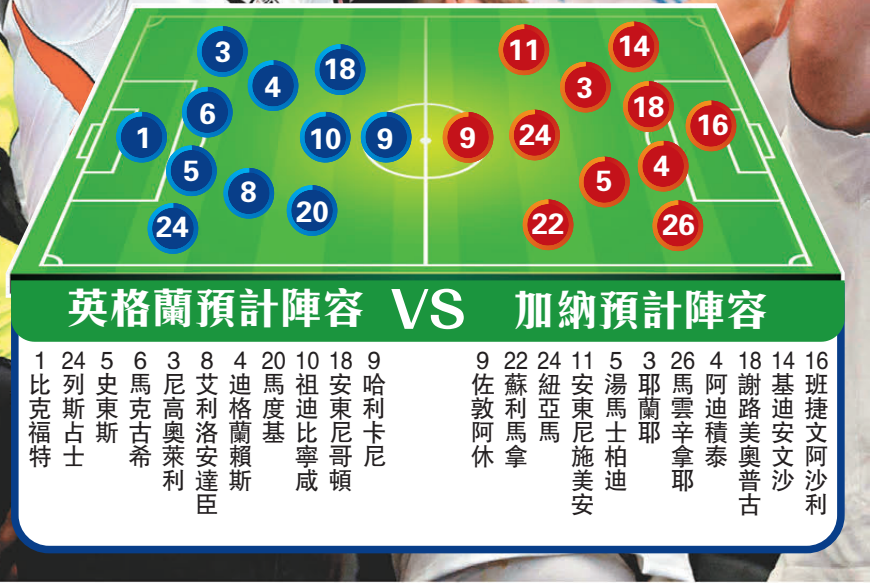
迪格蘭賴斯 英格蘭中場

英格蘭在分組賽在兩度被迫平下依然沒有自亂陣腳，最終以4：2擊敗克羅地亞。這場勝仗最關鍵的人物是哈利卡尼。他上半場梅開二度，12分鐘冷靜射入12碼先開紀錄，42分鐘再以頭錘為球隊重奪領先。對於強隊而言，最怕是踢得好但無法把握入球機會，哈利卡尼兩次在球隊需要時把握到機會，意味英格蘭的前場效率，依然要由隊長帶頭。