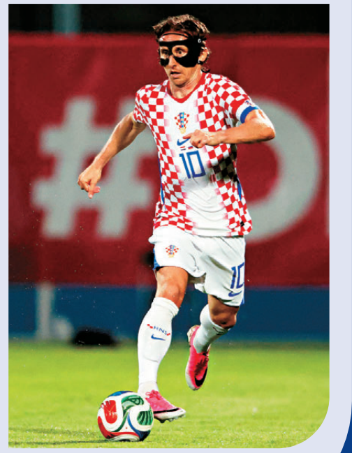
●克羅地亞依然依賴莫迪歷策動攻勢。資料圖片

球隊欠缺一位有足夠把握力的球員，如是役未有球員能挺身而出，面對級數較高的克羅地亞自然十分吃虧。