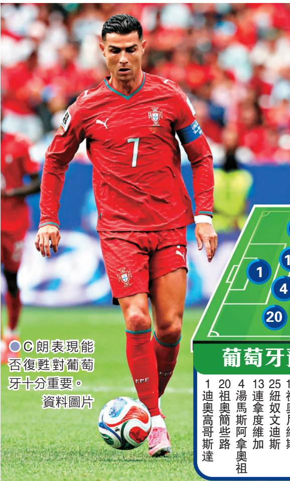
◎C朗表現能否復甦對葡萄牙十分重要。

至於加納方面，他們的速度與爆發力足以讓英格蘭感到不舒服，但反擊攻勢的處理必須有質素，若每次推到禁區邊便失去球權，英格蘭便能夠很快重新組織。另外，上場後備入替兼殺敵對手的20歲新星耶蘭耶也是看點之一，他表示，「我時刻做好準備應付任何情況，當你能夠擔任改變戰局的角色，第一個想法是：『我能射門嗎？』然後如果位置不太理想，你就會看看誰的位置更好，我想這就是我所做的。」