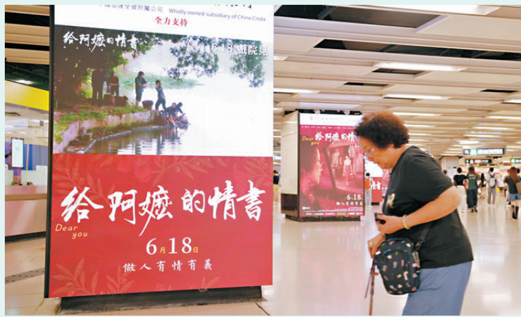
●電影《給阿嬤的情書》正在香港上映。電影通過普通華僑家庭的跨洋故事，引發華僑華人的強烈共鳴。

近日，一部沒有流量明星、沒有超級IP、沒有龐大宣傳預算的國產電影《給阿嬤的情書》，從內地市場一路蔓延至香港、東南亞乃至全球華人社會，引發跨越世代與地域的巨大回響。這部以潮汕方言、僑批文化及「下南洋」歷史為背景的小成本電影，不但創造了票房奇跡，更掀起一場關於歷史、文化、移民與身份認同的大討論。