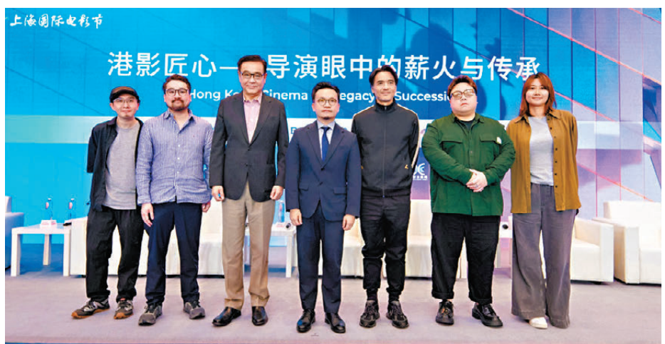
●香港新晉導演深度交流行業發展。