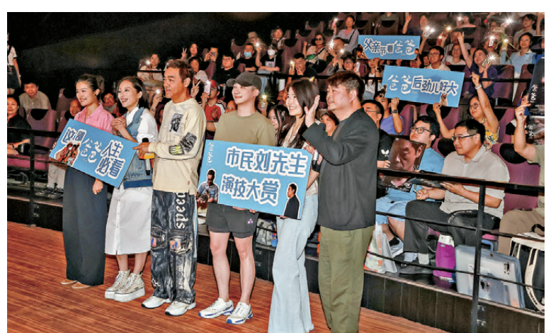
●《爸爸》主創與影迷合影紀念。