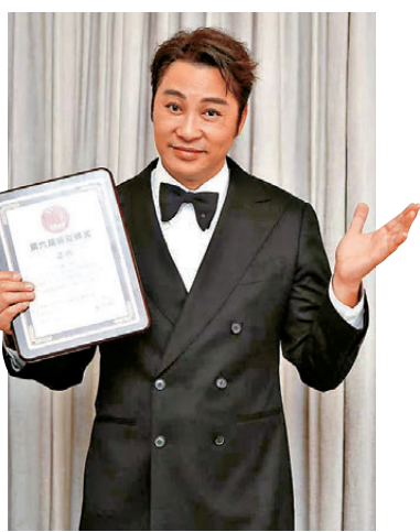
●譚耀文稱今次獲獎意義重大。

香港文匯報訊（記者 子棠）第六屆新時代國際電視節日前在澳門舉行，譚耀文（阿譚）憑藉電視劇《正義女神》獲提名「新時代現實題材最佳男主角」獎項並獲得殊榮。阿譚獲獎後感恩說：「很高興今天可以和大家聚在一起，首先要多謝大會對我的肯定，今次這個獎項競爭非常激烈，對手陣容強大，包括《罪罪2》的黃景瑜、《秋雪漫過的冬天》的趙又廷、《許我耀眼》的陳偉霆、《八千里路雲和月》的王陽。這個獎對我好有意義，我記得剛開始演劇時演古裝較多，幾年後才有機會拍攝時裝劇《壹號皇庭》。」阿譚回想起當初拍時裝劇首天開工，導演便叫Cut，要他講對白時不要成日皺眉頭，他當時真的覺得好hurt，自此以後便用心觀察如何把時裝劇演好，「多謝經理人這些年幫我爭取了很多不一樣的角兒，令我可以有空間提升演技，多謝TVB給我這個機會，多謝珍姐，多謝監製鍾澍佳再次讓我演律師，也要多謝在劇中有余詩曼這個咁強嘅對手，最後要多謝整個幕後團隊和導演，這個獎是我們共同努力得來的成果，多謝大家。」