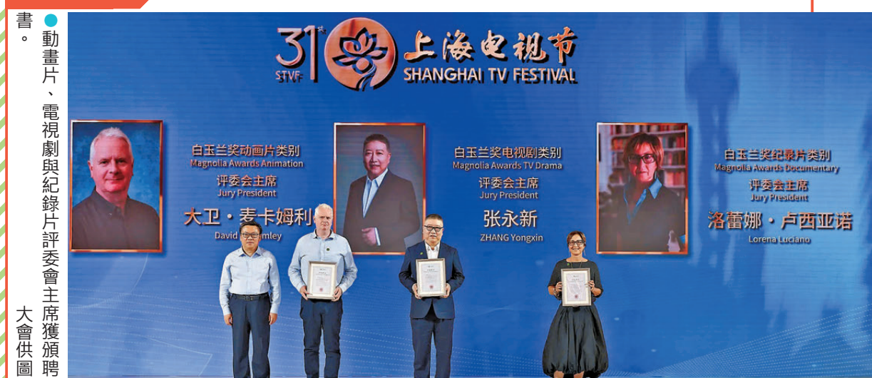
●動畫片、電視劇與紀錄片評委會主席獲頒聘書。

入圍今年白玉蘭獎的劇集共有十部，分別為《沉默的榮耀》《大生意人》《反人類暴力》《老舅》《蠻好的人生》《生命樹》《生萬物》