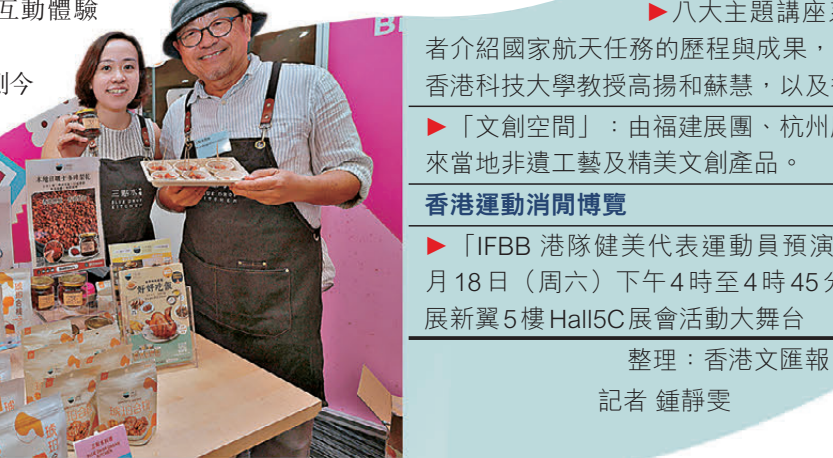
零食世界雲集近30個國家及地區、超過1,300款環球特色零食。

去年大受歡迎的「文創空間」今年載譽歸來，福建展團、杭州展位及香港展商集古齋將帶來當地非遺工藝、特色文創產品及IP精品。中國內地出版展館集合49個內地出版單位，帶來約20,000冊精品圖書。今年以雲南作為主題省，以「同飲一江水，共讀萬卷書」為主題，展現雲南多元的民族文脈。香港賽馬會亦將設置主題展區，透過互動體驗啟發大眾建立健康積極的生活。