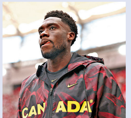
傷癒的加拿大球星戴維斯將獲得落場機會。