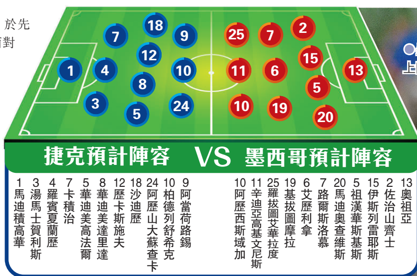
墨西哥門將奧祖亞預計有上陣機會。