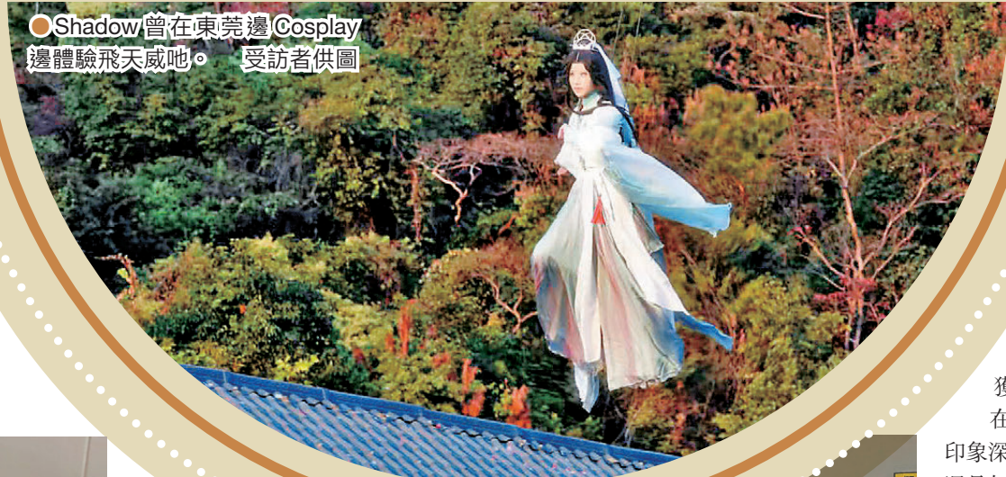
● Shadow曾在東莞邊Cosplay邊體驗飛天威地。