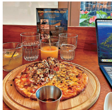
● 宋小姐品嚐香港西餐美食。

在飲食方面，宋小姐對本港眾多茶餐廳印象最深，它們看似平凡，卻以平價、美味和豐富的早餐選擇，贏得她的讚許。此外，香港的日式料理店數量和質量也超出她的預期，「香港有很多日式料理店，做得非常好吃。雖然我自己沒去過日本，但我覺得香港的日式料理，已經很接近我心目中對日式料理的期待了。」