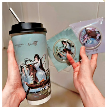
● Shadow會北上購買內地限定的動漫聯動周邊和奶茶。

回顧北上消費的前後變化，Shadow認為交通完善是帶旺北上消費的關鍵。「有別於過往港人北上多為探親，現時休閒消費已成主流，內地地鐵網絡貫通各大商圍及景點，不少目