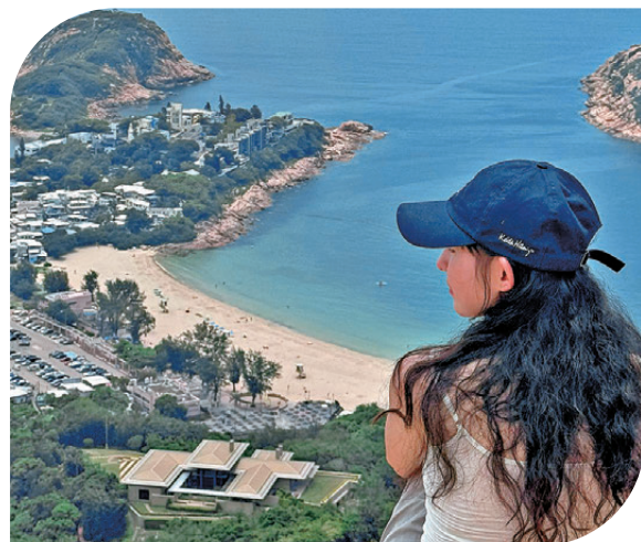
● 宋小姐在香港石澳的龍脊打卡，飽覽香港自然風景。