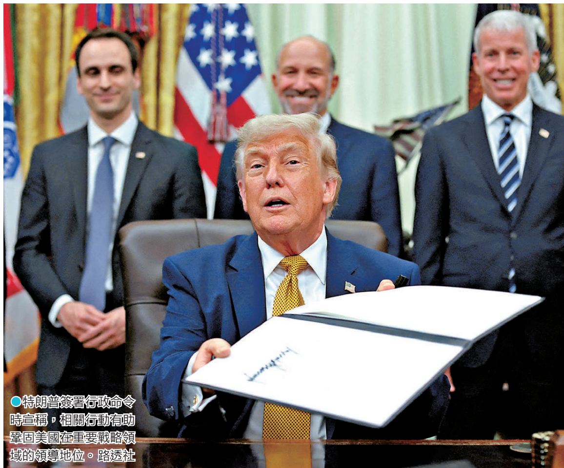
●特朗普簽署行政命令時宣稱，相關行動有助鞏固美國在重要戰略領域的領導地位。