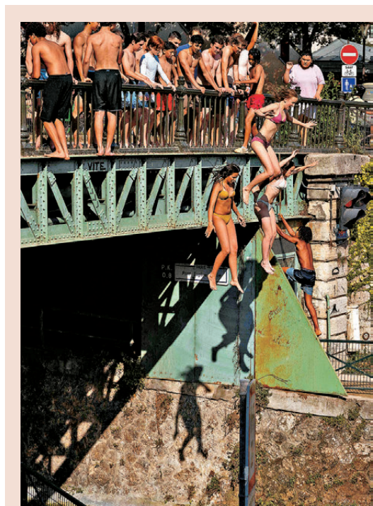
●法國民眾跳河消暑，但樂極生悲，過去一個周末有13人溺水身亡。