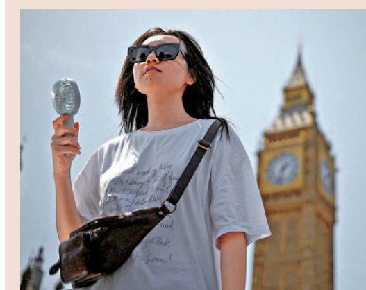
●英國罕見發布高溫紅色警報，自24日起生效。

香港文匯報訊 歐洲多國近日遭受逾攝氏40度高溫熱浪侵襲，英國氣象局罕見發布高溫紅色警報，自24日起生效。德國對森林大火風險發布第二高級警報，西班牙首都馬德里特別設置氣候避難設施，供弱勢群體使用。法國在今次熱浪侵襲中已有18人死亡，其中包括南部兩名在車內發現的幼童。