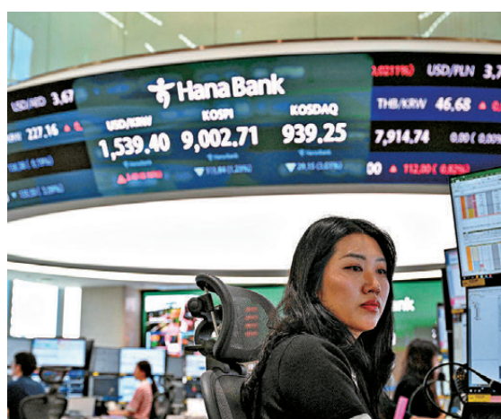
●韓國股市昨日大跌9.99%。

香港文匯報訊（記者 周紹基）韓國股市昨日在芯片股下挫拖累下，收市大跌9.99%。港股也隨外圍跌勢，一度跌逾500點，全日跌432點或1.8%，收報23,336點，成交3,344億元。港股連跌5日挫逾1,500點，再創一年新低。個多月以來，恒指已累跌逾3,000點。市場人士指出，今年來AI股熱炒，區內其他市場屢創高位，港股由於AI「含量」相對少，致表現較為落後，但當亞太區主要股市下挫，港股在負面投資氣氛下仍未能倖免。科技股重創，科指要跌3.3%，收報4,399點。