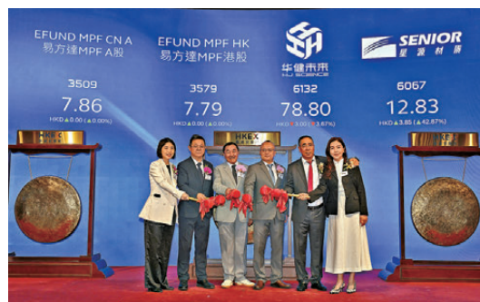
●昨日在港交所掛牌上市的新股有4隻，其中2隻為基金。

仙工智能於輝立交易場開報111.1元，較招股價101.6元升9.5元或9.35%；高低位分別是112元與65.95元，最終收報95.1元，跌6.5元或6.4%；以一手50股計算，投資者一手賬面蝕325元。仙工智能在耀才與富途的暗盤價則分別收報94.5元與94.2元，跌幅分別是6.99%與7.28%。