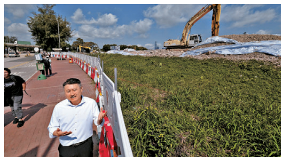
●為配合新田科技城工程，有停車場已停用並成為工地。姚銘期望有關當局密切審視相關需求。

●綠圈是因新田科技城工程而停用的停車場位置，藍圈一帶則是鄰近位置仍可使用的停車場，橙色則是經常塞車黑點。