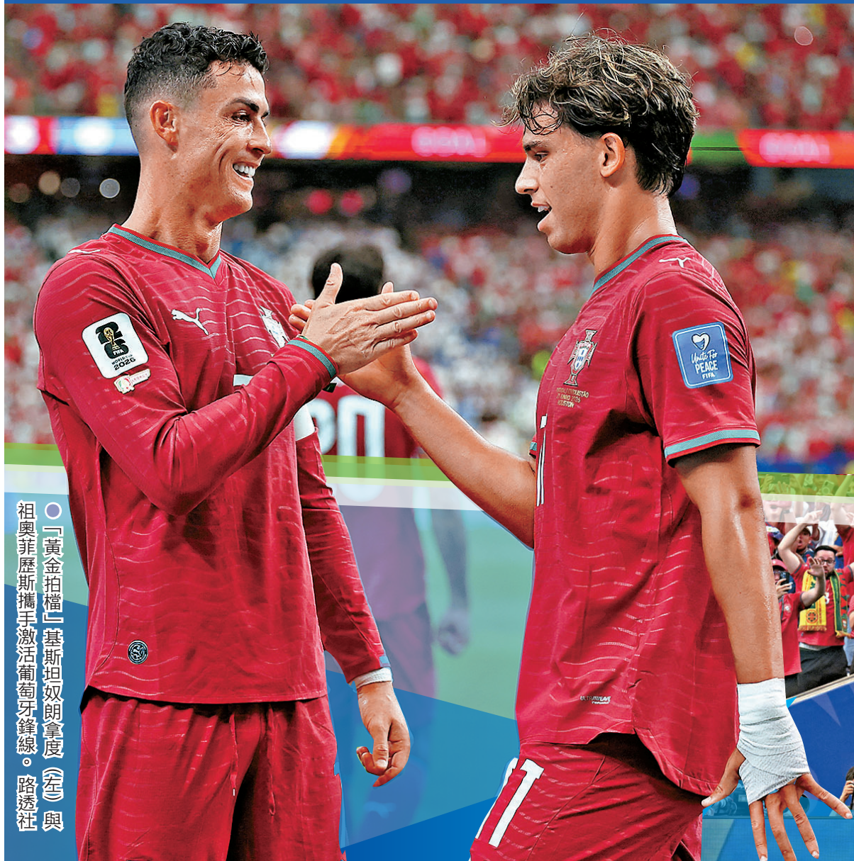
○「黃金拍檔」基斯坦奴朗拿度（左）與祖奧菲歷斯攜手激活葡萄牙鋒線。

葡萄牙今場對烏茲別克斯坦，甫開賽已展現強大爭勝決心，僅6分鐘C朗接應祖奧菲歷斯右路傳中近門撞入，終結長達10場國際大賽（世界盃及歐國盃）入球荒。到17分鐘，這位葡萄牙巨星更身體力行粉碎球隊內部不和傳聞，讓出罰球機會造就紐奴文迪斯勁射破網成2:0，之後C朗再接應般奴費南迪斯直線傳送單刀射入，加上對方的烏龍球以及後備上陣的拉菲爾利亞奧亦有進帳，最終葡萄牙以5:0大破烏茲別克斯坦一洗頹風，暫列K組次席，下場將與哥倫比亞爭奪首名出線資格。