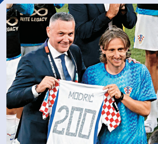
●莫迪歷（右）賽後獲克羅地亞足球總領贈200場紀念球衣。

浦璋表示，從現階段的狀態來說，看好阿根廷，「球隊的完整性，對大賽的經驗，以及主教練和隊員的融洽度，讓他們有奪冠的可能。我曾經歷過很多大賽，知道一支隊伍要走向冠軍，不僅在球場上的發揮，場下的互動動向也