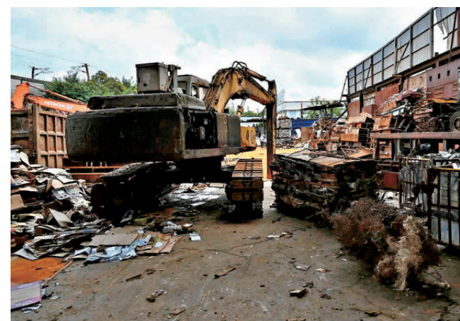
●無牌挖泥車操作員疑不慎撞倒正在車後工作的死者。

警方重申，若有人為疏忽、監管不力，以致有人嚴重受傷或者死亡，除了直接導致意外發生的前線工人，管理層亦可能因未能提供安全工作環境或監督不足而負上刑責。