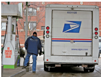
●特朗普斥油企未相應調降汽油零售價格。

香港文匯報訊 美國總統特朗普24日表示，已下令對大型石油公司展開調查，原因是美國汽油價格居高不下。