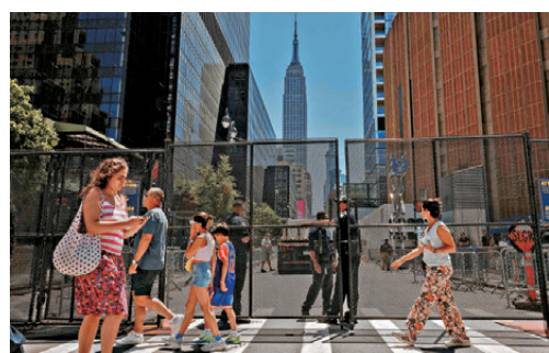
●美國民眾普遍認為特朗普發動的對伊朗軍事行動並不值得。 資料圖片

這項民調亦顯示，52%受訪者認為這場軍事衝突並不值得美國付出代價。隨着選舉氣氛升溫，這項數據勢必引起白宮高度關注。