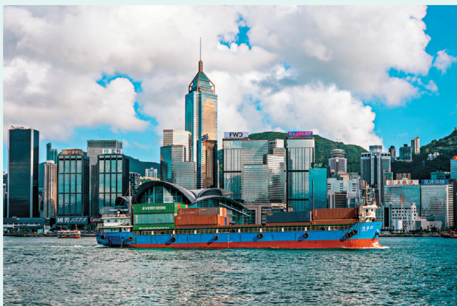
●5月香港整體出口和進口貨值均錄得按年升幅，均大升逾四成。 中通社

據統計處數字顯示，香港5月商品整體出口貨值為6,112億元，按年上升40.8%，為連續第27個月上升；5月份商品進口貨值為6,554億元，按年上升42%，是連續第17個月增長，也是連續3個月錄得超過40%的升幅。5月份錄得有形貿易逆差442億元，相等於商品進口貨值的6.7%。數字顯示，香港今年首5個月的商品整體出口貨值按年上升36.2%，同期商品進口貨值按年上升39.6%。今年首5個月錄得有形貿易逆差2,422億元，相等於商品進口貨值的8%。