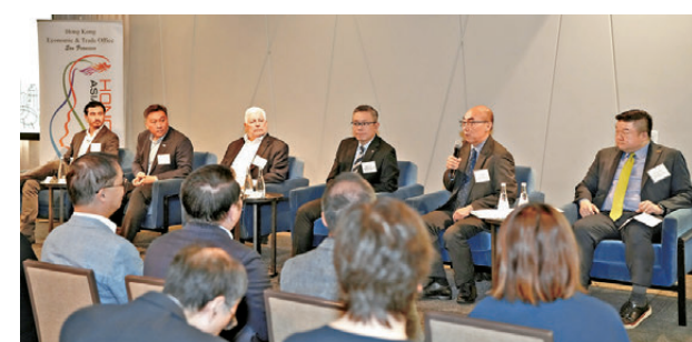
●特區政府駐三藩市經貿辦與科技園公司、投資推廣署及香港貿發局攜手合作，透過「經貿一站通」平台支援香港代表團參展BIO 2026。