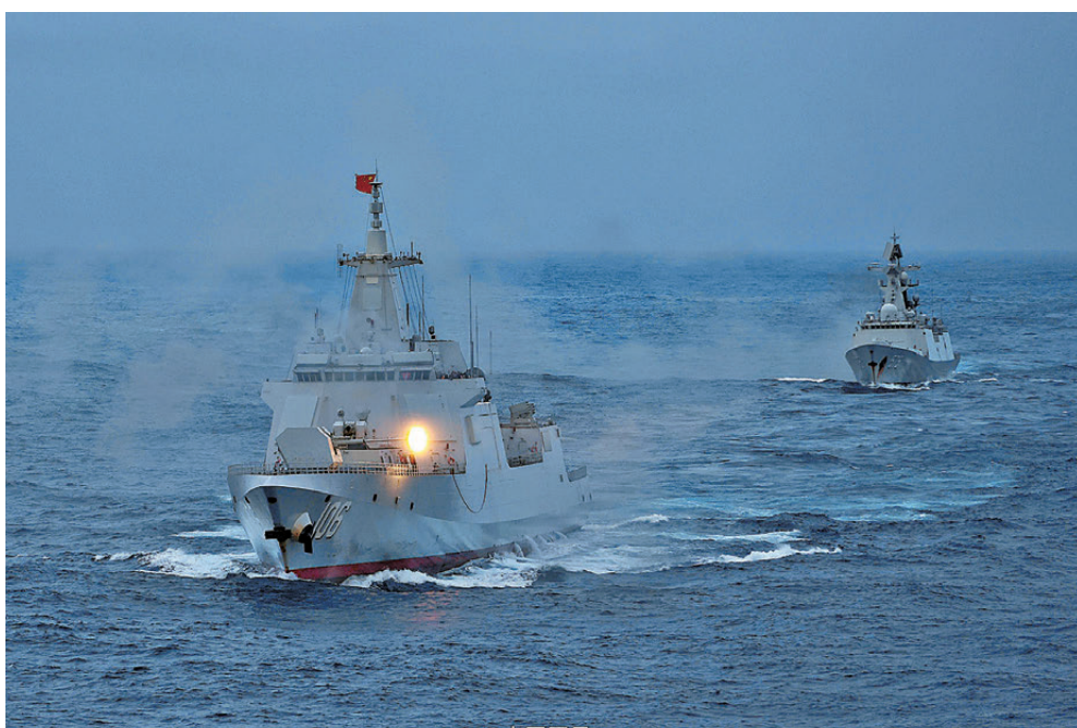
●「正義使命—2025」實彈演習中，兩艘攻擊艦海南艦編隊協同東部戰區相關驅護艦、無人機等兵力，開展立體投送、精兵破襲、奪控要港等科目演練。資料圖片