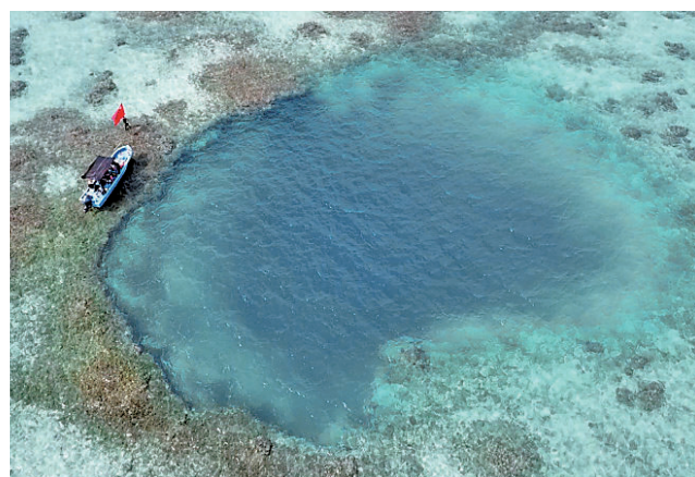
●中國黃岩島首次發現珊瑚藍洞。

生態環境部介紹，黃岩島藍洞屬於世界罕見的珊瑚礁生長結構成因型海洋藍洞，洞口面積約1,491.7平方米，最大直徑56.3米，深度16.6米，內部結構呈漏斗狀，洞底狹窄，存在水體溫度分層。地質年代學研究初步表明，該藍洞至少形成於距今3,200年前。報告指出，多年來，黃岩島瀉湖內相鄰尖礁或（和）點礁不斷發育，在氣候變化、海平面升降等多重自然因素影響下，礁體之