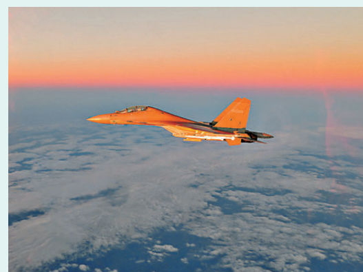
●早前，東部戰區空軍編隊飛赴台島南北兩端相關海空域開展演練。資料圖片