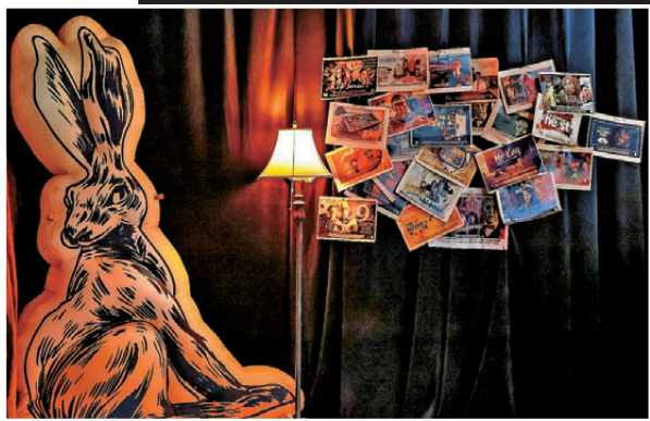
●進入劇場前的漫長通道上，裝飾十分具氛圍感。