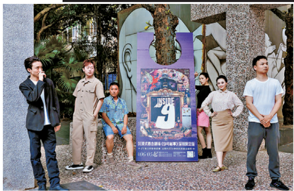
●《9號秘事》演員為固定班底，跟隨劇組巡演。