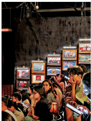
●台階觀眾席為觀眾提供上帝視角。