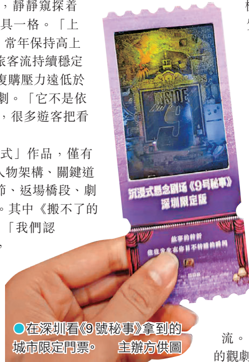
●在深圳看《9號秘事》拿到的城市限定門票。

此外，為了讓喜歡沉浸式互動體驗的觀眾更有代入感，劇目設置雙重視角觀演區。「池座可與演員近距離互動，適合熱愛冒險、偏愛參與感的E人；台階觀眾席提供上帝視角，滿足喜歡安靜窺視、遠距離觀察的I人，覆蓋不同性格觀眾的觀劇偏好。」導演趙淼說，在地化內容調整集中在互動環節，自己在實踐觀察中發現，華南觀眾心態更鬆弛、娛樂屬性更強，所以也會要求演員放開互動尺度，增加對視、遊戲化交流。「這與我們在北京演出時，北京觀眾內斂的觀劇氛圍形成鮮明反差。」