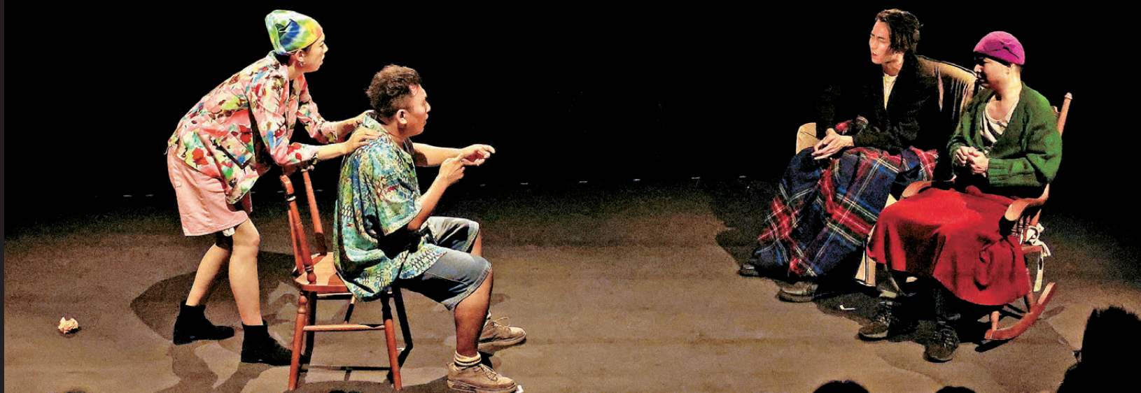
●《9號秘事》演出劇照