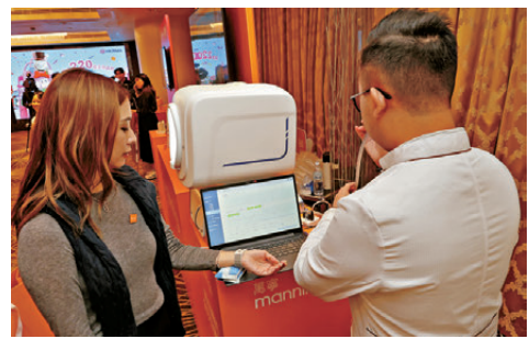
●萬寧智能四診儀示範。

多個電子支付平台同步加推額外優惠：AlipayHK消費立減高達60元現金回贈、WeChat Pay HK及微信支付提供專屬匯率優惠等，讓消費者盡享折上折優惠。