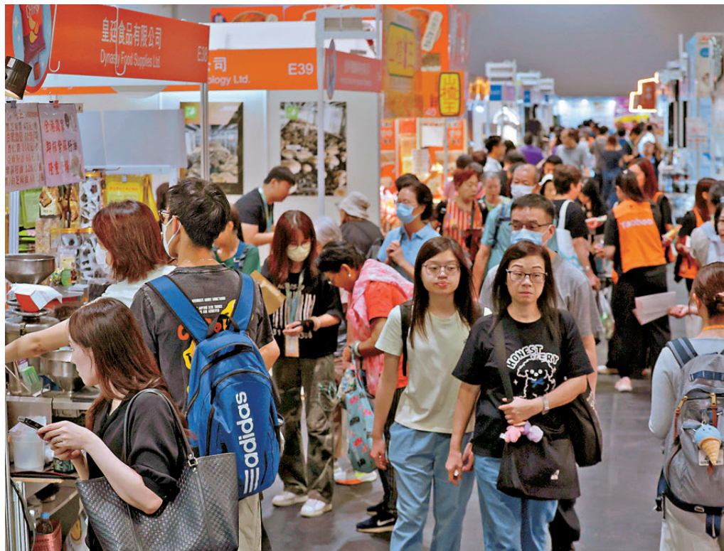
●購物節首天人流如鯽。