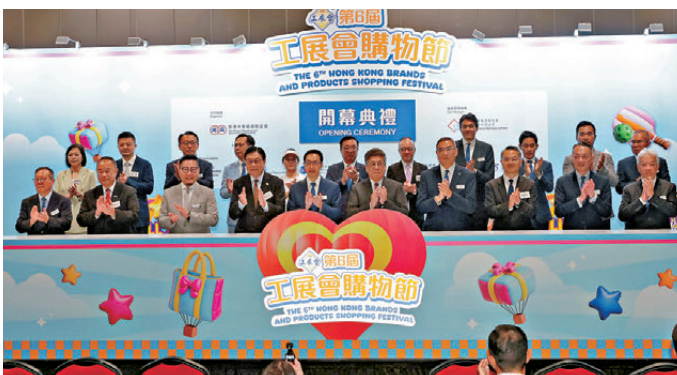
●「工展會購物節」昨日開幕。

香港文匯報訊(記者 朱欣欣)由香港中華廠商聯合會主辦的「第六屆工展會購物節」昨日在亞洲國際博覽館舉行開幕典禮，一連四日(26日至29日)為市民及旅客帶來「食、買、玩」一站式夏日體驗。有首次參展的商戶滿意昨日首天人流，相信今日及明日的周末假期，將有更多市民和旅客入場，以往有參展的四川參展商則表示今屆增加貨品數量，期望藉參展推廣其產品。