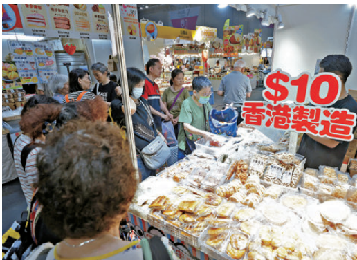
●有市民專程入場選購心儀貨品，讚揚性價比高，收穫滿滿。