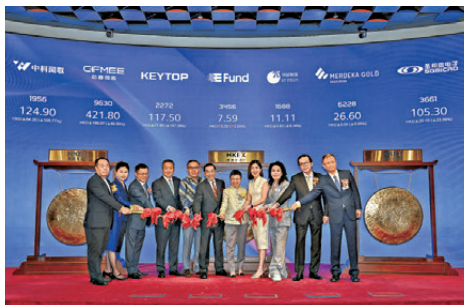
●六隻新股及首隻追蹤「港交所科技100指數」的ETF昨日掛牌。

此外,聖邦微電子(3661)收升47.066%,投資者每手(100股)賬面賺4,010元。領益智造(1688)潛水4.6%,投資者每手(660股)賬面賺310.2元。印尼金礦公司MERDEKA GOLD