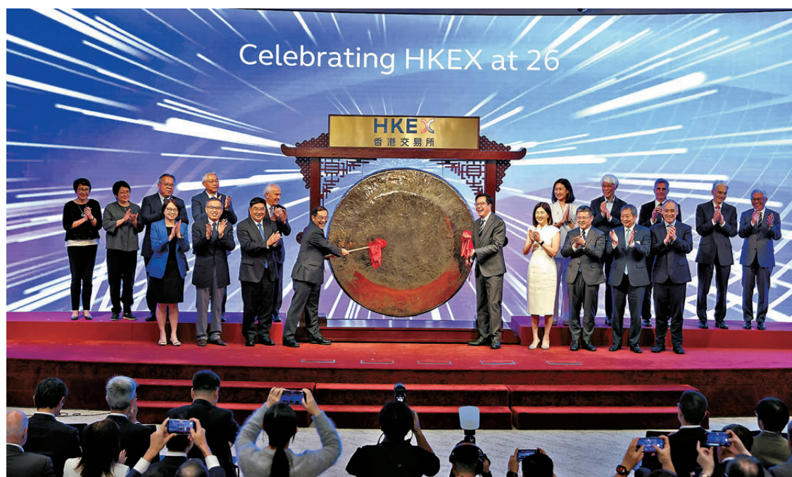
●特區政府署理財政司司長黃偉綸(前右五)與港交所主席唐家成(前左四)敲鑼慶祝港交所上市26周年。