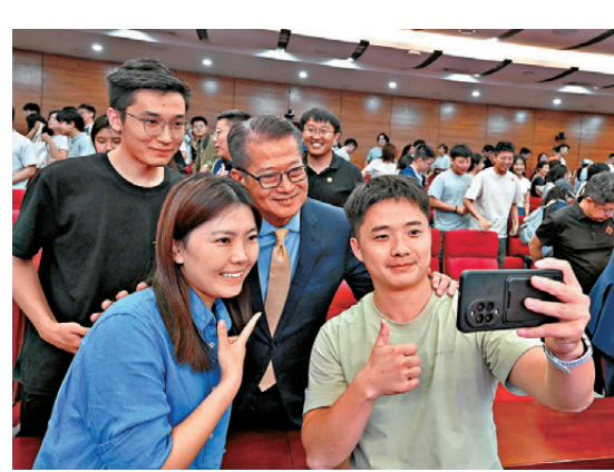
●財政司司長陳茂波(右二)昨日在西北工業大學的座談會上與參與人士合照。

香港文匯報訊(記者 蔡競文)正在率領香港創科企業代表團進行大連及西安訪問行程的財政司司長陳茂波,昨日在西安西北工業大學(西工大)發表演講,提出「西安研發、香港賦能、全球應用」。他向西工大的同學們發出邀請,歡迎他們到香港實習、工作、深造。他表示,香港願意做你們的夥伴;如果你們的技術需要國際資本和專業支持,香港有豐富的資源;如果你想有更多參與國際市場運作的經驗,香港有最生動的課堂。