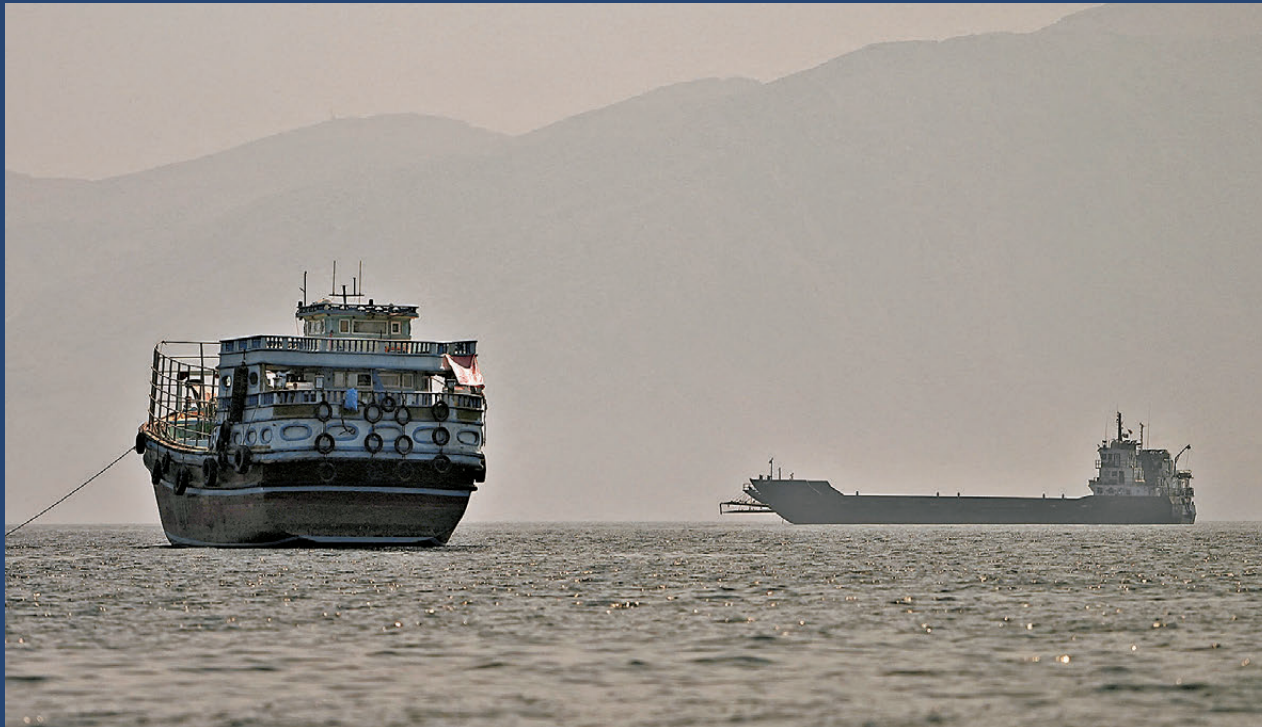
●有船隻停泊在霍爾木茲海峽附近的阿曼海域。

香港文匯報訊 國際海事組織6月25日宣布，一艘船隻當天在阿曼灣遭襲，該組織決定暫停霍爾木茲海峽滯留船隻的疏散行動，以進一步確認相關安全措施是否有效。《華爾街日報》報道，伊朗伊斯蘭革命衛隊當天在霍爾木茲海峽襲擊一艘懸掛新加坡國旗的貨船，革命衛隊海軍發言人稱，船隻通過霍爾木茲海峽必須與革命衛隊協調，違規船隻將受處置。