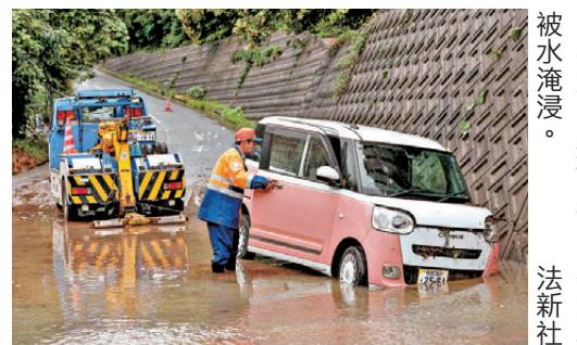
●在大阪府柏原市，有汽車被水淹沒。

在京都府精華町，由於預期發生山泥傾瀉及土石流，當局26日向東畑地區239戶發出最高級別的