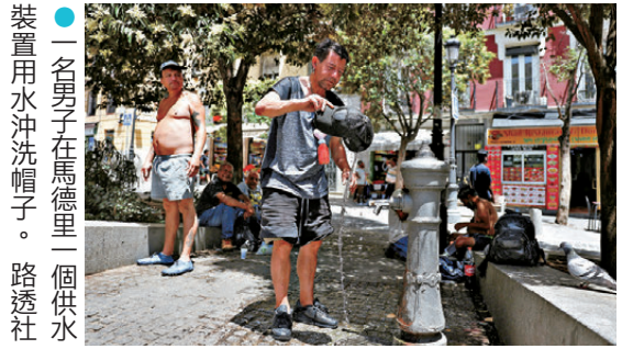
●一名男子在馬德里一個供水裝置用水沖洗帽子。

法新社報道，根據天氣預報和歐盟聯合研究中心人口數據估算，歐洲至少有1.01億人預計週遭