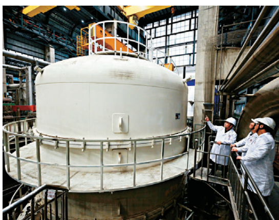
●26日，科研人員在檢查高溫超導中心螺管線測試平台。