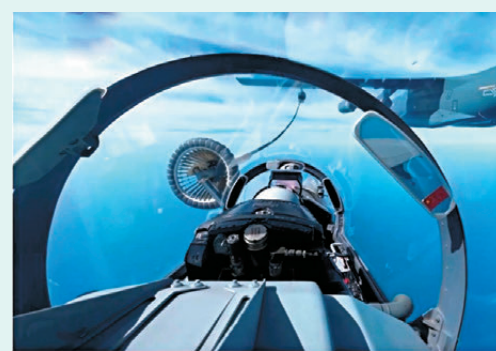
●27日拍攝的參加巡航的戰機。