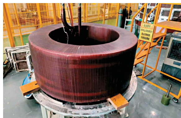
●高溫超導中心螺管線磁體。