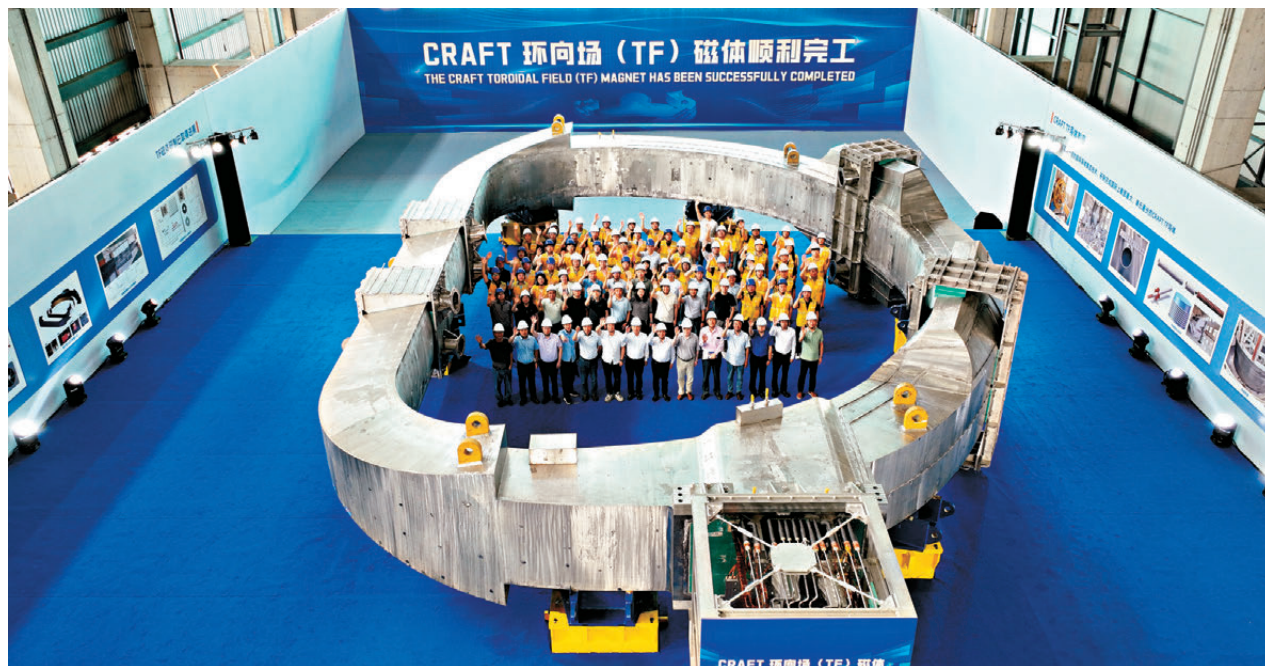
●「人造太陽」項目兩套聚變堆關鍵超導磁體先後完成研製驗收與滿參數測試。圖為6月27日，項目組成員和驗收組專家與聚變堆環向場超導磁體合影。 新華社

此外，在項目實施過程中，國內多家優勢企業深度參與，形成了覆蓋關鍵材料、核心部件、製造工藝和系統集成的協同攻關體系，圍繞高性能超導材料、特種結構件、高精度製造和加工等多個核心環節聯合攻關，有力支撐了這一重大裝備的自主化研製，也帶動了中國聚變工程高端裝備製造能力和產業配套能力的整體提升，為下一步聚變堆建設奠定了堅實基礎。