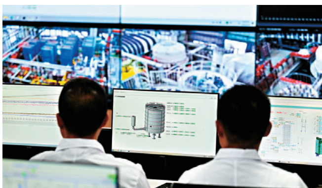
●26日，科研團隊對高溫超導中心螺管線進行滿參數測試。