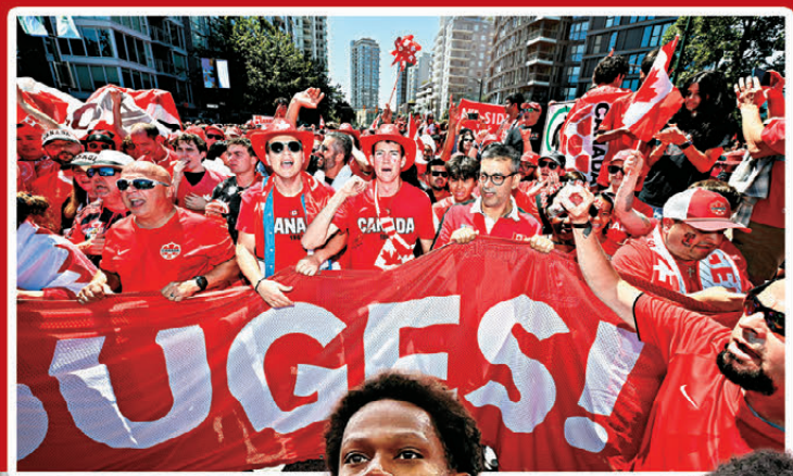
約拿芬大衛 加拿大前鋒