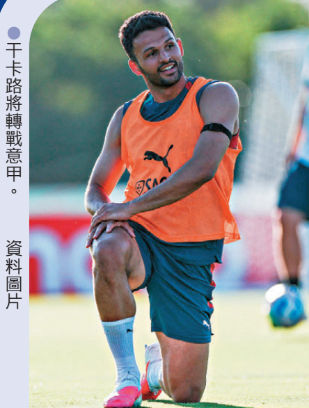
●干卡路將轉戰意甲。