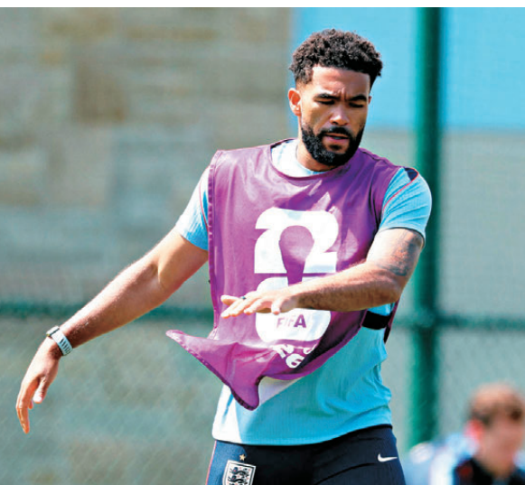
●列斯占士傷勢頗為嚴重。