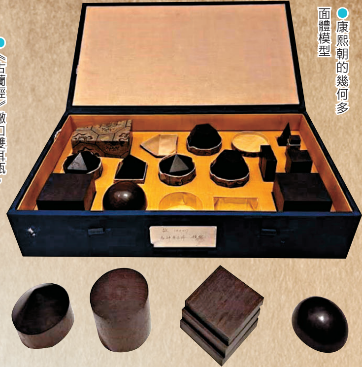
●康熙朝的幾何多面體模型