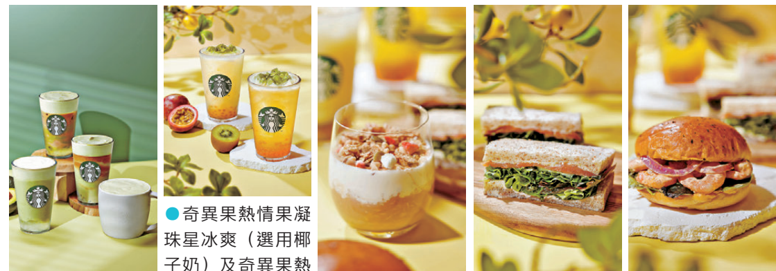
●奇異果熱情果凝珠星冰爽（選用椰子奶）及奇異果熱情果凝珠檸檬星冰 ●印度香料茶燕麥杯 ●煙三文魚青瓜忌廉芝士香麥三文治 ●拉差香辣鮮蝦軟包三文治 ●綿雲牛油果系列 爽