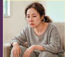
●氣虛質的人缺乏動能，提不起勁。