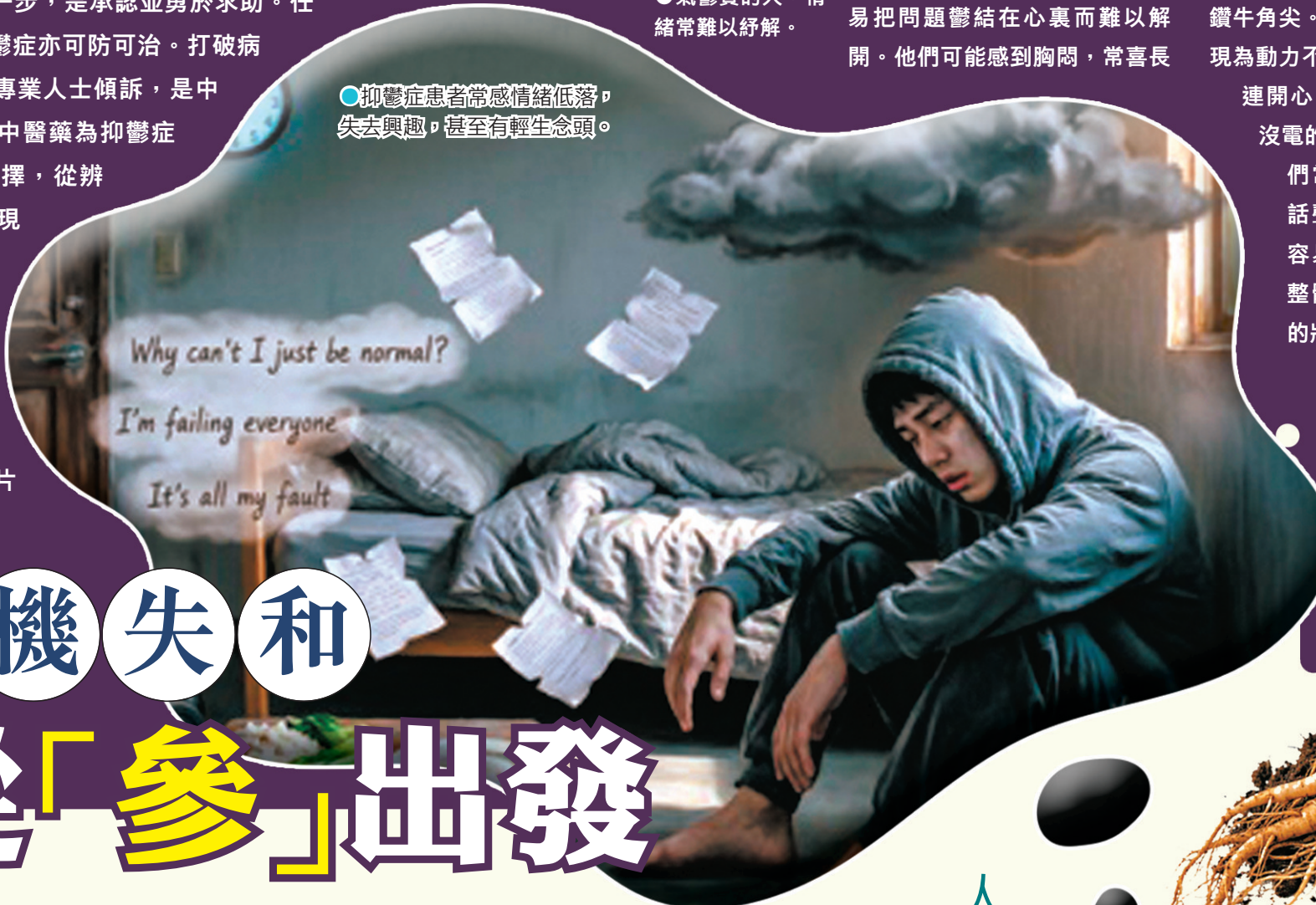
●抑鬱症患者常感情緒低落，失去興趣，甚至有輕生念頭。