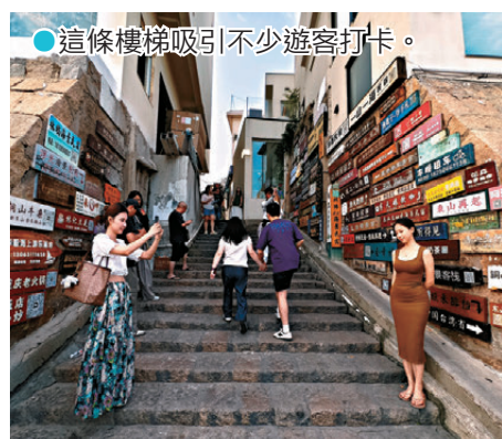
● 這條樓梯吸引不少遊客打卡。