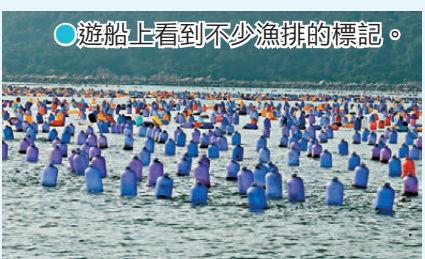
● 遊船上看到不少漁排的標記。