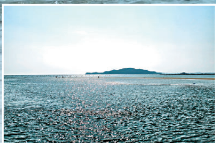
● 船上看到魚骨沙洲，也看到遊客像在海中央。