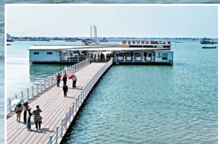
● 必須在這兒出海，乘船至魚骨沙洲觀光。