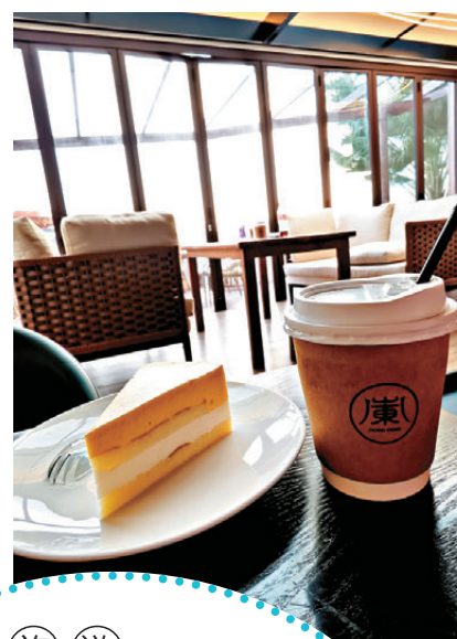
▶ 下午的時候到達南門灣，可至餐廳品嘗下午茶。