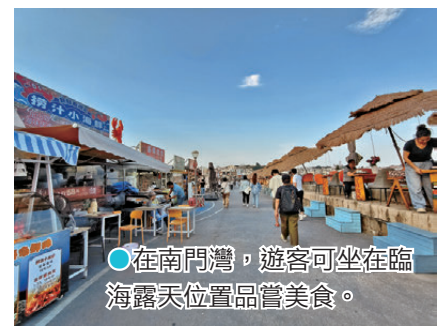
● 在南門灣，遊客可坐在臨海露天位置品嘗美食。