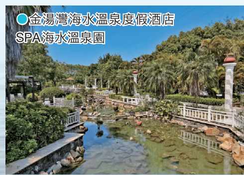
● 金湯灣海水溫泉度假酒店 SPA海水溫泉園

空間。酒店以「海水溫泉」為最大特色，泉水取自深海，富含多種礦物質，對養生與舒緩身心極具功效。酒店坐落於海灣之畔，擁有壯麗的海景房間，讓旅客在休憩時即可欣賞碧海藍天。