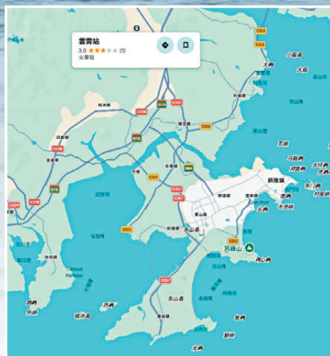
● 雲霄站與東山島所在地，東山島形狀如蝴蝶。

作為電影《左耳》等影視作品的取景地而聲名大噪的南門灣，是東山島的熱門海灣。它位於東山縣銅陵鎮，是一處月牙形的自然內灣。這裏因「馬卡龍色系」的彩色漁村、潔白沙灘與蔚藍海水交織的美景而聞名，素有「福建版聖托里尼」之稱。沿着南門灣散步，一邊是夢幻的蔚藍大海，一邊是錯落有致的彩色小鎮，漫步其間，彷彿置身於意式小鎮與台式清新交融的慵懶氛圍中。