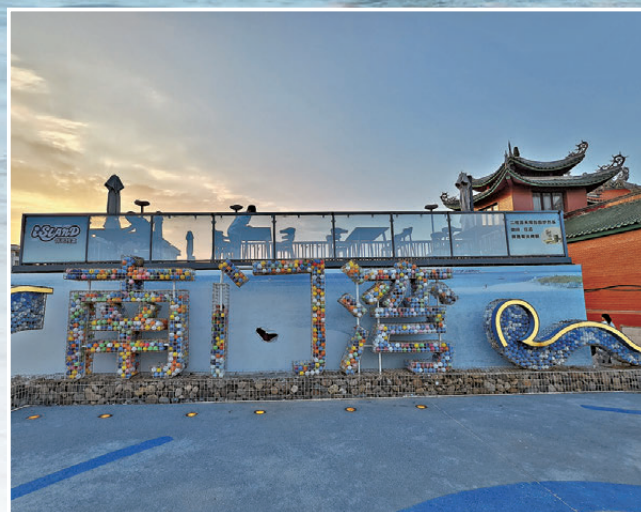
● 南門灣打卡位充滿文藝氣息。