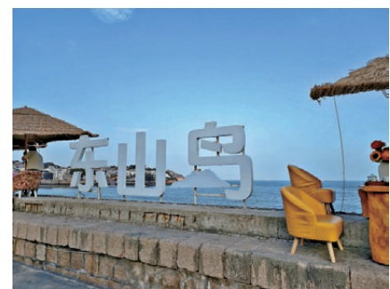
● 南門灣的東山島標記

交通：從漳州或廈門有客運班車直達東山島銅陵鎮，抵達後可步行或搭乘當地交通工具前往南門灣。