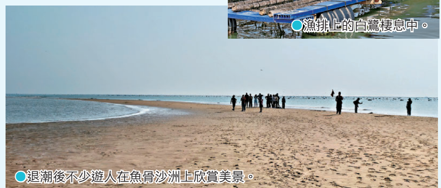
● 退潮後不少遊人在魚骨沙洲上欣賞美景。