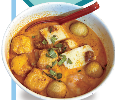
回味工房的新加坡風味傳統叻沙