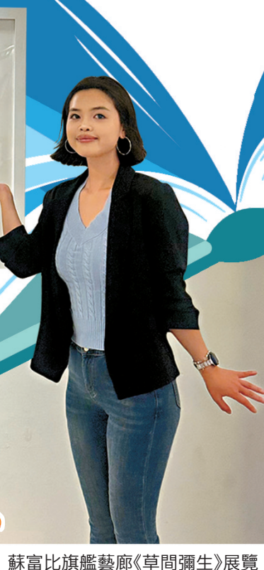
蘇富比旗艦藝廊《草間彌生》展覽。