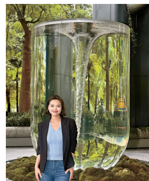
The Henderson 藝術裝置《Anatomy of Time》