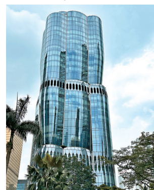
The Henderson 大樓外觀