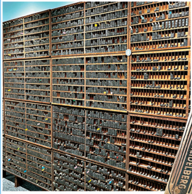
PMQ元創方「點止執印切釘——書的藝術」展覽