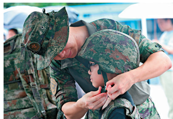
●石崗軍營周日開放日，官兵細心地為小朋友戴上頭盔。

謝小朋友和妹妹特意與全副武裝的駐港部隊官兵合照。謝小朋友說，透過這次參觀軍營，深深感受到祖國的強大，「剛才看到獵人戰鬥演練，覺得他們既威武英勇，又很有型。」