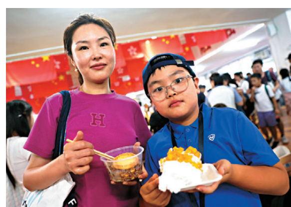
●顏女士與兒子。