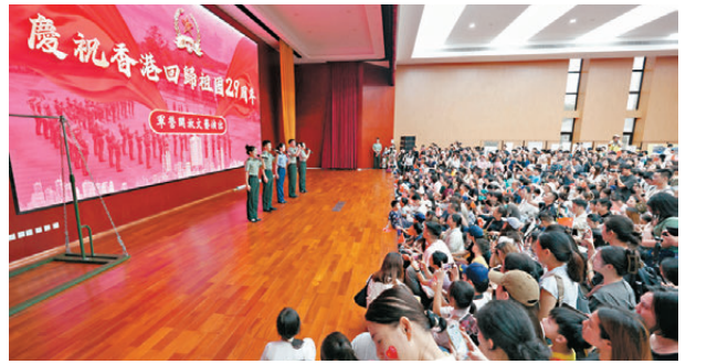
●新圍軍營開放日，軍營有文藝演出。