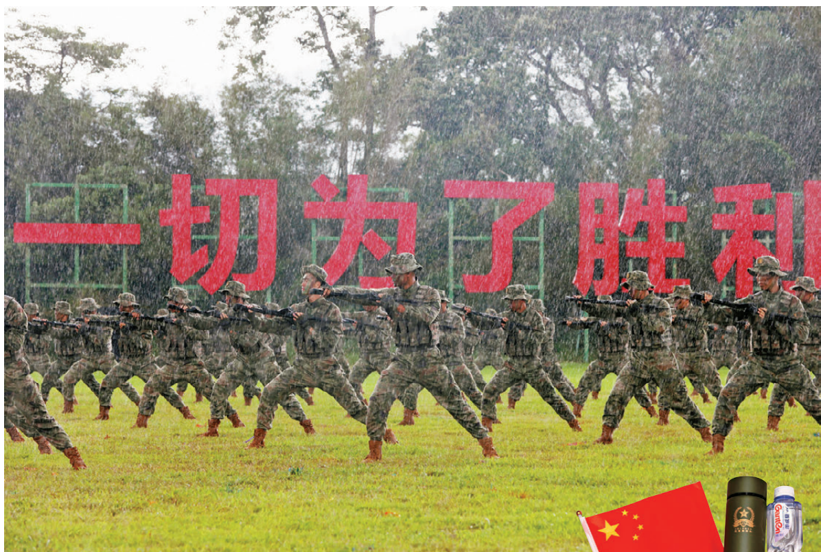
●石崗軍營周日開放日，駐港部隊官兵冒雨演示刺殺操。