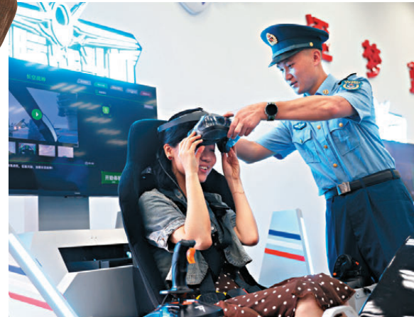
●女孩在石崗軍營體驗VR模擬飛行系統。