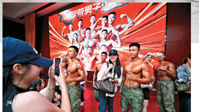
●文藝演出中最引人注目的是名為「軍營男子漢」的健美操。

被問及為何選擇演唱《海闊天空》及《光輝歲月》時，他們說這兩首粵語歌更能體現部隊與香港市民面對面交流互動的情誼，「在演唱的途中，能感受到香港市民們那種發自內心對我們駐港官兵的喜愛，這是對我們這場文藝演出的肯定。」