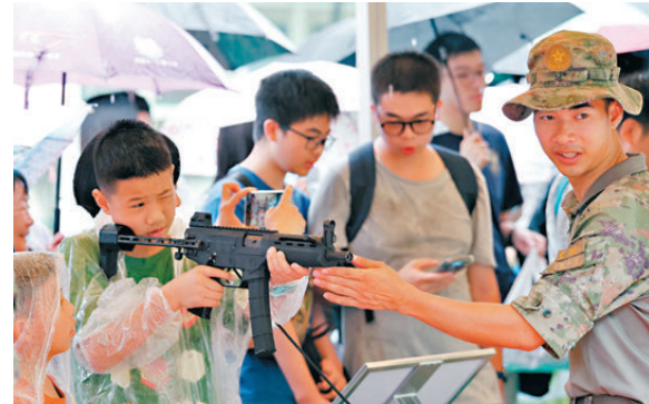
●新圍軍營開放日，小朋友在官兵的耐心指導下「操作」槍械。