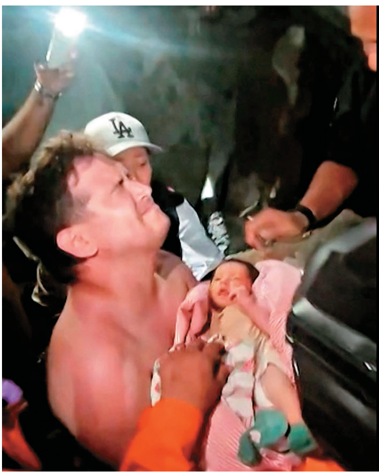
● 搜救人員將嬰兒交回其父親手中，父親緊閉眼睛表現激動。

據法新社和路透社報道，位於委國北部沿海城市拉瓜伊拉是受災最嚴重地區之一，當地至少100棟包括高層住宅在內的大樓因強震毀損或倒塌。地震發生後，當地居民和志願者因重型機器不足、官方救援力量有限，只能徒手在瓦礫堆中尋找生還者。社媒流傳的影片顯示，搜救人員於26日夜間在探照燈協助下，從倒塌的瓦礫堆中救出一名嬰兒，其被包裹在棉被中，由搜救人員小心翼翼地接力傳遞，現場響起陣陣掌聲。