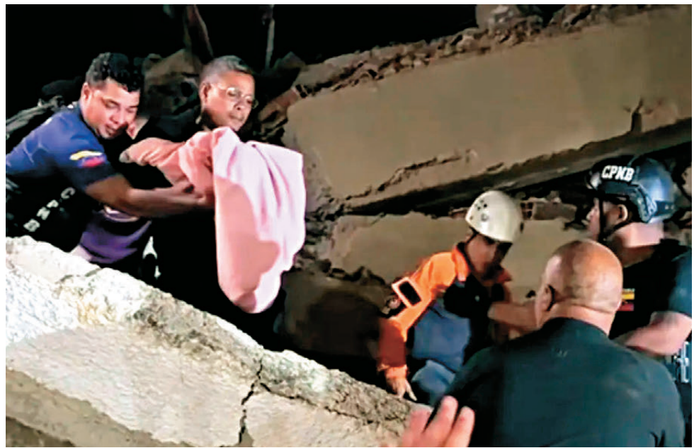
● 搜救人員於26日夜間在探照燈協助下，從倒塌的瓦礫堆中救出一名嬰兒，其被包裹在棉被中。

香港文匯報訊 委內瑞拉6月24日傍晚發生的連環地震，官方證實已增至1,430人罹難，而據中國駐委大使館消息，截至當地時間27日下午，已確認有8名中國公民遇難。在搜救爭分奪秒進行之際，接連傳出令人鼓舞的消息，一名僅18日大的嬰兒在受困32小時後奇跡獲救，另有一名11歲男孩遭廢墟掩埋3天後被救出，為救援工作帶來希望。