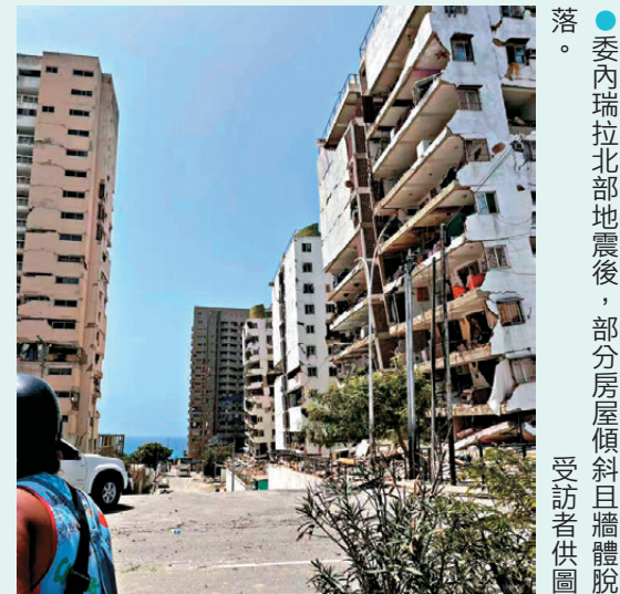
● 委內瑞拉北部地震後，部分房屋傾斜且牆體脫落。

數據顯示，旅居委內瑞拉的廣東恩平籍華僑華人超過20萬人，約佔恩平海外僑胞總數三分之一。恩平市僑聯有關工作人員說，當地僑團會館正持續組織救災和幫扶行動，已有多名恩平籍僑胞獲救並得到妥善安置。同時，恩平市已成立工作專班，統籌推進各項對接工作；針對已公布的遇難人員，該專班同步對其在中國國內的家屬開展走訪慰問，協助處理善後事宜。