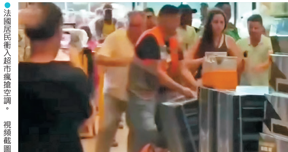
法國居民衝入超市瘋搶空調。視頻截圖