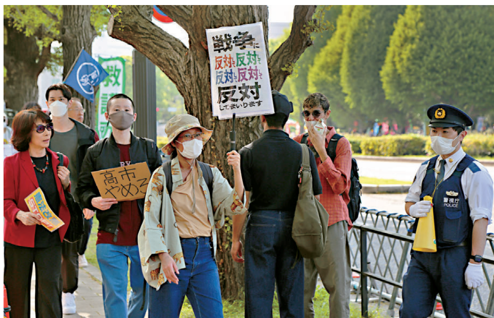
●中方再制裁40家日本實體。圖為早前日本民眾在位於東京的國會議事堂前集會，抗議高市早苗政府強推修憲、企圖解禁殺傷性武器出口等破壞和平憲法的動向。

此外，中方還將三井E&S株式會社等20家無法核實兩用物項最終用戶、最終用途的日本實體列入關注名單。商務部新聞發言人說，列單後，出口經營者向上述實體出口兩用物項，不得申請通用許可或者以登記填報信息方式獲得出口憑證；