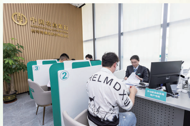
●農行廣東分行為客戶開立多功能自由貿易賬戶。

近年來，農業銀行聚焦粵港澳大灣區機場、鐵路、公路、住房建設等重點領域，持續加大信貸投放，優化金融服務，積極為大灣區一體化「破壁聯通」貢獻金融力量。