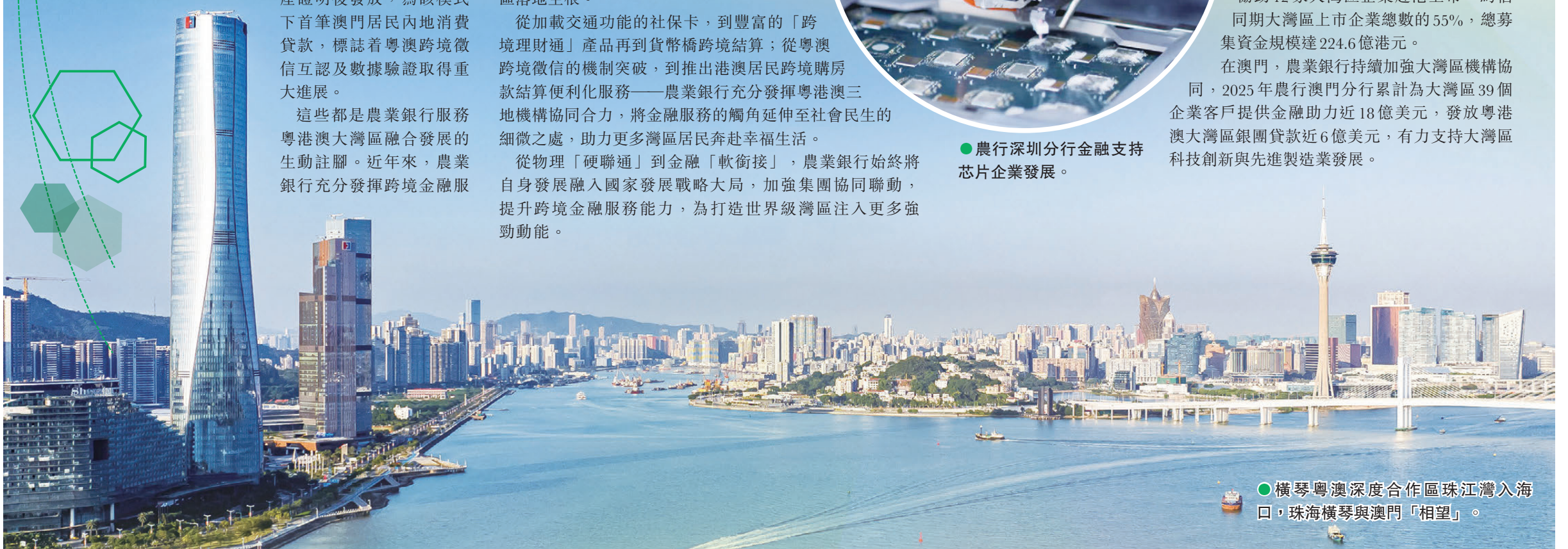
●橫琴粵澳深度合作區珠江灣入海口，珠海橫琴與澳門「相望」。

從物理「硬聯通」到金融「軟銜接」，農業銀行始終將自身發展融入國家發展戰略大局，加強集團協同聯動，提升跨境金融服務能力，為打造世界級灣區注入更多強勁動能。