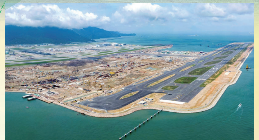
●農行香港分行積極支持香港機場局的香港機場第三跑道擴建項目。