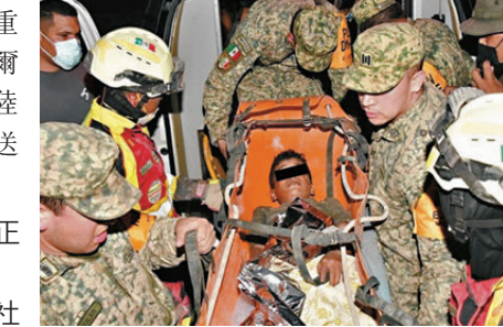
●一名九歲男孩正被救援人員救出。

美國南方司令部29日表示，約130名美國海軍陸戰隊員預計24小時內抵達拉瓜伊拉港，協助港口重啟，軍艦「勞德代爾堡號」已透過登陸艇，將首批物資運送至拉瓜伊拉港。