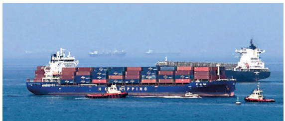
●一艘貨輪停泊在阿曼灣碼頭附近海域。

峽附近商船為由，再次打擊伊境內多個目標。伊朗伊斯蘭革命衛隊28日稱，革命衛隊使用導彈和無人機，摧毀位於科威特的薩利姆空軍基地，以及位於巴林的美軍第五艦隊8處美軍重要基建。