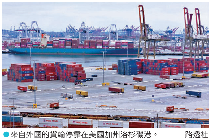
●來自外國的貨輪停靠在美國加州洛杉磯港。

香港文匯報訊 英國《金融時報》報道，美國總統特朗普計劃以「強迫勞動」為由，對全球約60個國家徵收新關稅，全球貿易商為趕在關稅生效前搶運貨物，紛紛加速備貨，導致貨