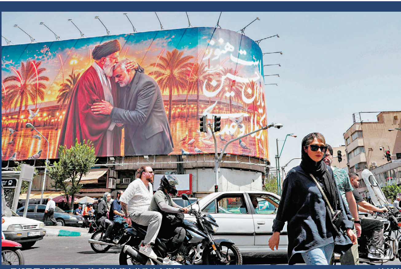
●伊朗民眾走過德黑蘭一棟建築外牆上的政治宣傳。

香港文匯報訊 美國與伊朗近日再次交火，互相指責對方違反本月較早時達成的停戰諒解備忘錄。美方官員6月28日披露，美伊兩國已同意停止互相襲擊，由於局勢升級，原定30日在瑞士舉行的談判，改為在卡塔爾首都多哈進行，談判重點從伊朗核計劃轉為聚焦霍爾木茲海峽問題。伊朗外長阿拉格齊同日表示，伊朗會全權負責霍爾木茲海峽管理，獨攬控制權限。