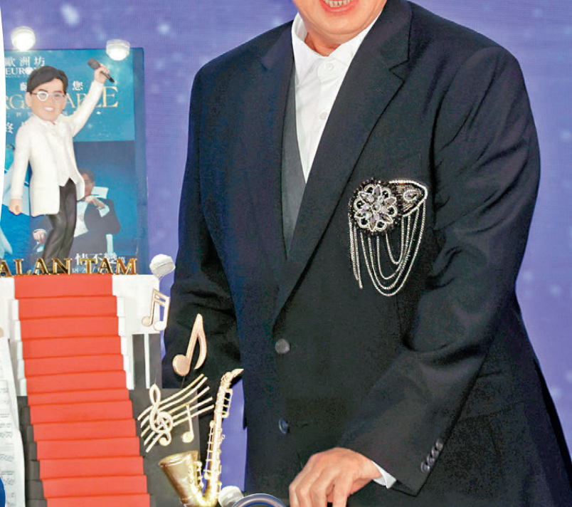
●譚詠麟獲贈「阿倫日報」。