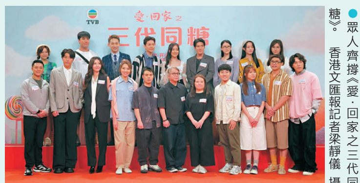
●眾人齊撐《愛·回家之三代同糖》。