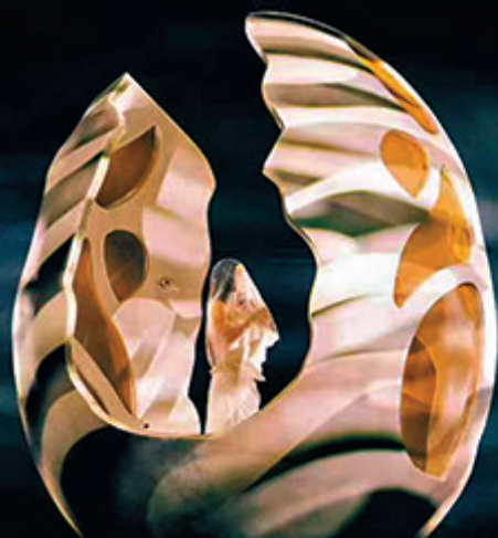
●單依純用一座「蛋島」來表達破殼新生的自我發展心路。