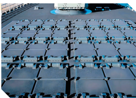
●冷熱共架通用垂直發射系統

南寧艦130毫米主炮和米波雷達後方，各有32單元垂直發射裝置。這套64單元垂發能混裝反艦導彈、防空導彈和對陸攻擊導彈，堪稱海上「萬能武器庫」。既能打擊數百公里外的敵艦，還能攔截來襲飛機、對陸目標精確打擊。這種「冷熱共架、一坑多彈」的能力，標誌着中國海軍在艦載武器集成度上已躋身世界一流。