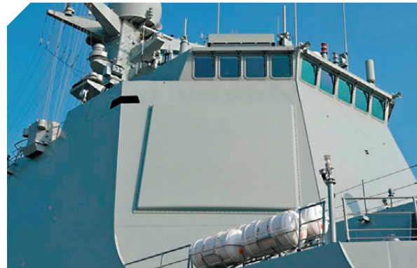
●S波段346型有源相控陣雷達

052D型導彈驅逐艦被譽為「中華神盾」，源自艦橋上方四面巨大的S波段346A型有源相控陣雷達。在南寧艦上，其探測距離超過300公里，能同時追蹤上百個空中和水面目標。作為052D改進型，南寧艦還換裝了外形酷似「蒼蠅拍」的新型反隱身米波有源相控陣雷達，即便面對美軍F-35這類隱身戰機，也能精準鎖定。