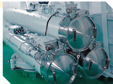
●三聯裝輕型反潛魚雷發射管

從南寧艦、衡陽艦的後甲板登艦，進入艙室內部通道向艦艏方向行進，便能看到三聯裝輕型反潛魚雷發射管。這套發射裝置左右舷各有一座，採用迴轉式結構，平時隱藏在艙門內，發射時蓋板打開並轉向舷外，即可對敵潛艇發射魚雷-7等輕型反潛魚雷。其與艦殼聲吶、反潛直升機共同構建起艦艇多層次反潛體系。