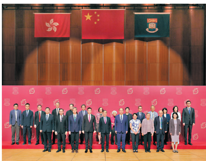
港大昨日舉行升旗典禮。