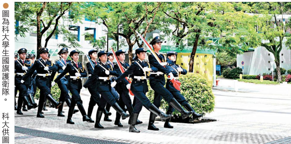
圖為科大學生國旗護衛隊。科大供圖