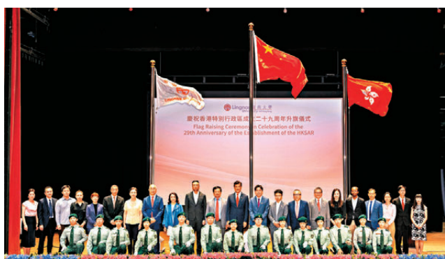
嶺大舉行升旗禮，慶祝香港特別行政區成立29周年。