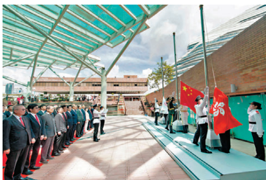
理大昨日於校園舉行升旗儀式。