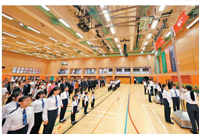
教大昨日舉行香港特別行政區成立29周年升旗儀式，邀得來自不同區域的學校代表共同參與。