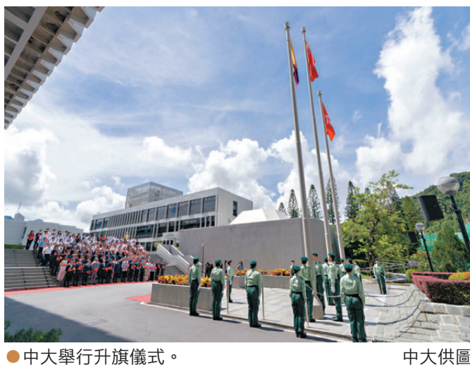
中大舉行升旗儀式。