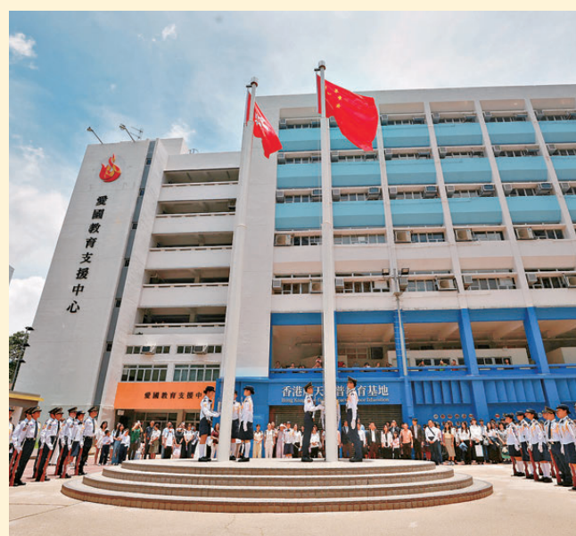
香港升旗隊總會成員以流暢動作完成莊嚴的升旗儀式。

高令峰表示，之後會在校透過「國旗下的思辨課」、主題研學及常規課堂去培養學生的愛國素養。