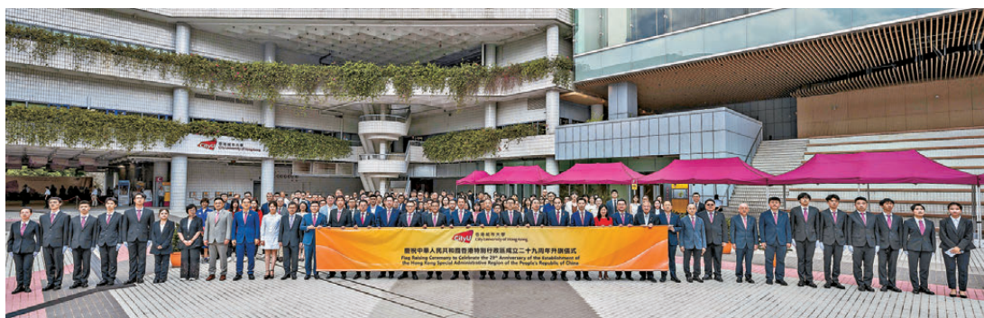
城大昨日在城大廣場舉行升旗儀式。

香港大學、香港中文大學、香港科技大學、香港理工大學、香港城市大學、香港浸會大學、嶺南大學、香港教育大學、香港都會大學、香港恒生大學、香港樹仁大學及聖方濟各大學等，昨日均在校園內舉行升旗禮。