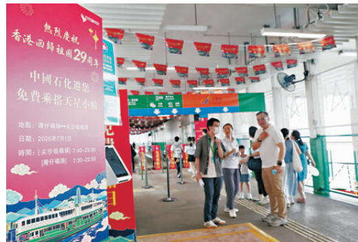
●中石化贊助天星小輪灣仔—尖沙咀來回免費乘船日。

另一方面，本港多項文娛設施免費開放，包括故宮文化博物館與M+博物館。截至昨晚7時，M+有接近30,000人次入場參觀，打破自2021年開館以來的單日入場人次紀錄。至於香港故宮文化博物館則有超過8,700人次入場參觀，較去年「七一」增加兩成。