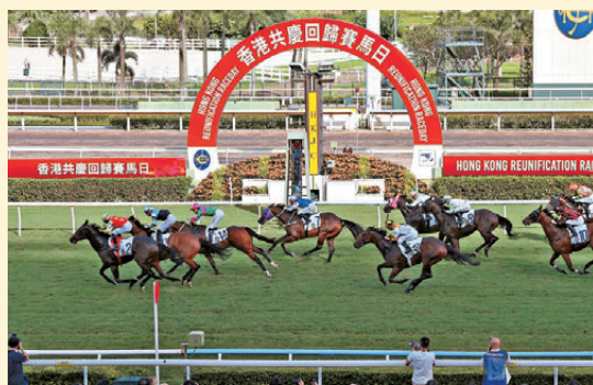
●沙田馬場「香港共慶回歸賽馬日」吸引逾2.7萬人入場。

美國旅客Brad專程來港參加獅子會國際年會，順道參觀馬場。他對香港馬場的龐大規模與熱烈氣氛讚嘆不已，認為可媲美美國著名的「肯塔基打吡大賽」，並對回歸賽馬日的各場重點賽事充滿期待。