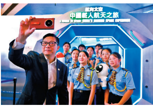
●鄧炳強相約一班民安隊少年團團員參觀航天展覽。

間食肆享用午餐，享用數碼港為慶祝香港回歸推出的餐飲優惠。商務及經濟發展局局長丘應樺與政務司李華到快餐店消費。醫務衛生局局長盧寵茂與副局長范婉雯到港式茶餐廳用膳。