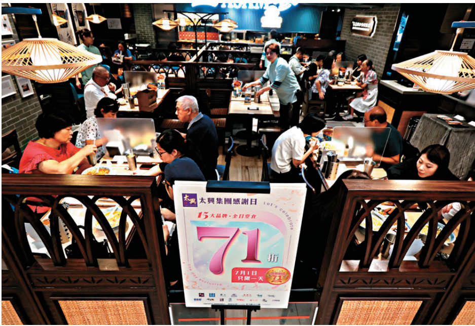
●有連鎖飲食集團代表指出，提供優惠既是慶祝香港回歸祖國，也是鼓勵市民留港消費。

為慶祝香港特別行政區成立29周年，特區政府和社會各界推出一系列特別優惠及活動，涵蓋公共交通、文化藝術及消閒、飲食及消費等範疇，與廣大市民一同歡度回歸。香港文匯報記者昨日走訪多區直擊市道情況，有提供全線分店堂食七折優惠的連鎖飲食集團代表指出，提供優惠既是慶祝香港回歸祖國，也是鼓勵市民留港消費。有享受優惠的本地食客認同政府推出一連串慶祝活動，不少更是持續多天，有助延長普天同慶的氛圍。另有內地旅客享受免費搭乘渡輪優惠，認為一連串回歸慶祝優惠既能吸引內地遊客到訪，亦能拉近兩地民眾的距離。 ●香港文匯報記者 鍾靜雯