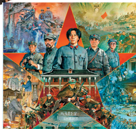
●電影《四渡》已在香港各大院線上映。