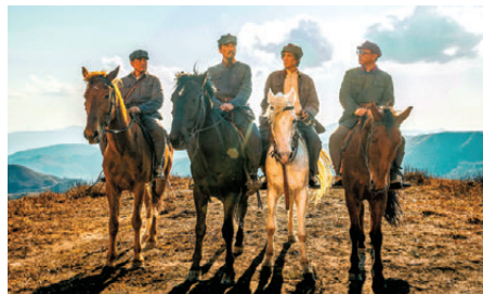
●片中演員飾演（左起）朱德、周恩來、毛澤東及劉伯承的造型。