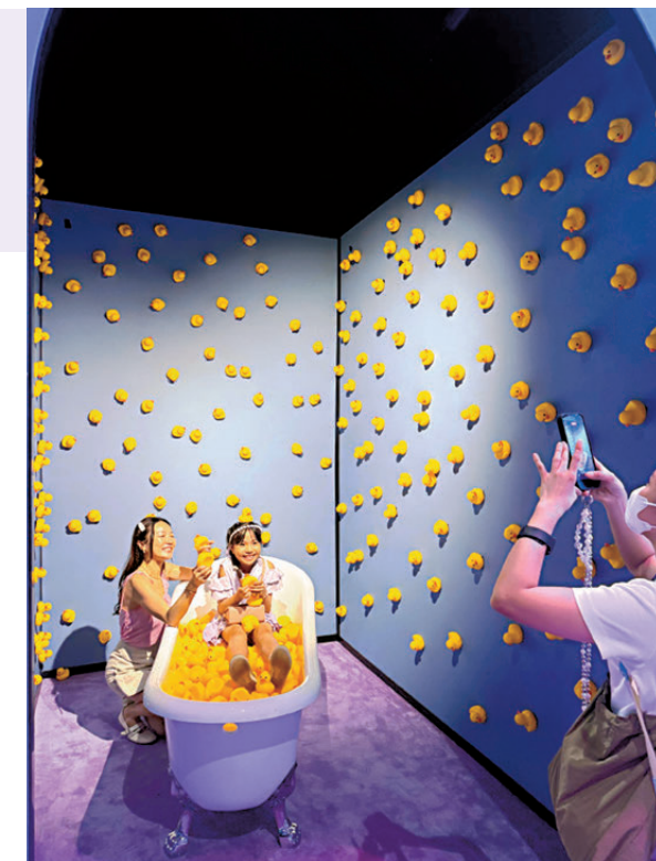
●富有童趣和創意的自拍房

眾前來親身體驗。至於和科技的結合，已經十分流行的VR眼鏡體驗自然不必多說，更有創意的當屬現場安排的諸多可供觀眾自主創作和玩耍的裝置，你既可以用畫筆畫出你心目中的海洋生物，也可以玩與藝術相結合的感官遊戲，諸如通過給「打氣筒」打氣這一動作和屏幕上的人物互動：一邊打氣一邊看着屏幕上的「蒙娜麗莎」也吹出泡泡來並隨着打氣筒持續進氣而致使屏幕上的泡泡「破裂」；又或者通過吹氣裝