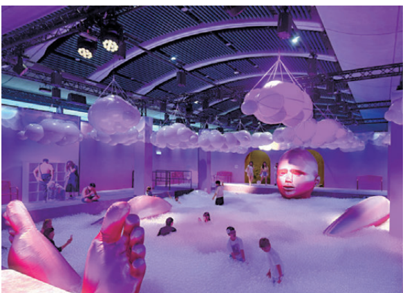
●超大的沉浸式泡泡浴池

「泡泡星球體驗展」旨在讓兒童和成人都得到放鬆和享受，在場地設計中則兼具了美感和童趣。在「自拍房」板塊，十幾個小空間依次排開，從小黃鴨浴池到室內鞦韆，置景的精緻度和創意從這一板塊可見一斑，十分適合親子互動以及喜歡拍照的觀