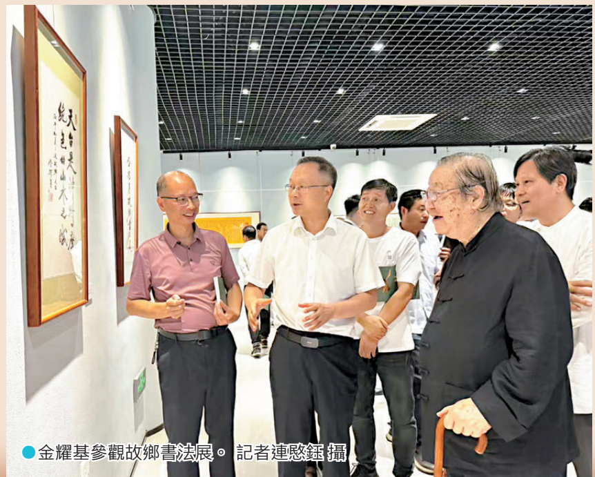
●金耀基參觀故鄉書法展。

六月末，浙江天台，薄霧籠罩白鶴鎮的山頭，細雨紛飛中，「金耀基學術館」開館儀式暨「金耀基故鄉書法展」開幕典禮在此舉行，知名學者、香港中文大學原校長金耀基第四次返回故里，見證以其名字命名的學術場館落地故土。學術館系統陳列其畢生學術著作，而本次書展是他首度以「故鄉」為題辦展，展出近百幅精品墨跡。 ●文：香港文匯報記者 連啟鈺