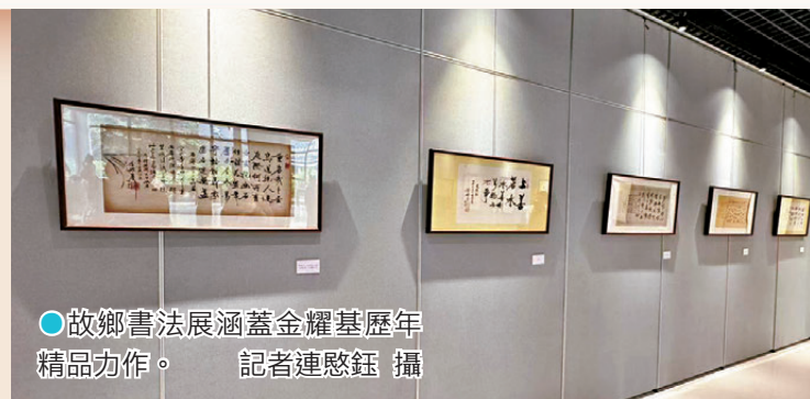
●故鄉書法展涵蓋金耀基歷年精品力作。