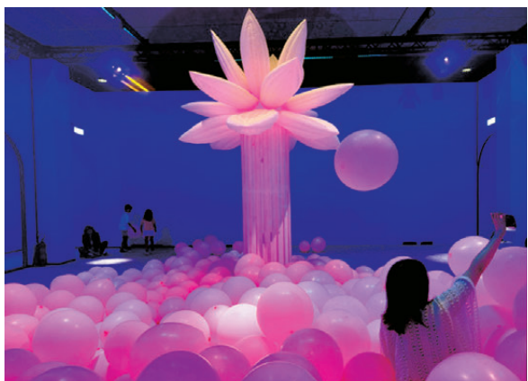
●粉紅色的泡泡海洋

是次展覽，尤重「體驗」，佔地27,000平方英尺的11個主題展場依次排布開來，讓觀眾從進入展覽的第一秒鐘就開啟一場關於「泡泡」的神奇冒險。要說進入這片「泡泡星球」最為開心的，一定是孩子們。拋開VR技術、主題房間和奇幻場景等裝置上的華麗和用心，單就各種形態的「泡泡」的數量之多和形態之奇異，都足以讓每一位富有童心的大人和孩子尖叫連連。其中，最令人印象深刻的當屬巨型「泡泡浴池」，充氣式的「巨人」以仰臥姿態躺在巨大的「泡泡浴」中，神情沉浸而悠閒。偌大的「泡泡浴池」則敞開懷抱迎接所有渴望一場「泡泡派對」的大朋友和小朋友。不同於常見的五顏六色的海洋球遊樂設施，構成「泡泡浴池」的所有充氣球均為白色透明狀，在視覺上最大程度模擬「泡泡浴」，無論是在其中遊玩還是打卡出片都會給人帶來十分的享受。粉紅色的「泡泡海洋」更是吸引了孩子們的眼球，想像一片由粉色氣球構成的海洋，其中又生長出一株粉紅色的海洋植物，有誰