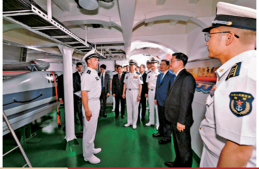
●李家超及周霽等主禮嘉賓登艦參觀。