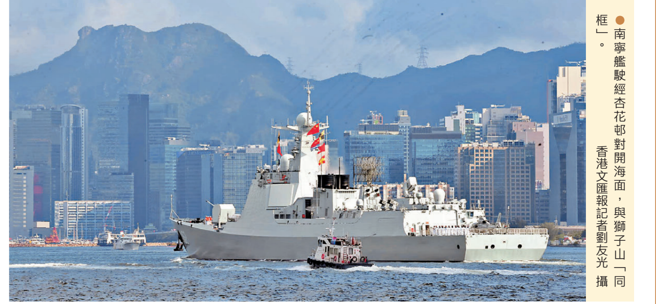
●南寧艦駛經杏花邨對開海面，與獅子山一「框」。

他續說，軍艦開放期間會舉辦一系列軍事體驗、訓練展示、文藝表演等互動交流活動，希望讓市民更深入了解新時代國防和軍隊建設發展情況。編隊還有很多展示科目，包括信號旗語、損管戰術演示、槍械展示，以及海軍特有的繩結等，期待與廣大市民朋友在昂船洲軍港碼頭相見。