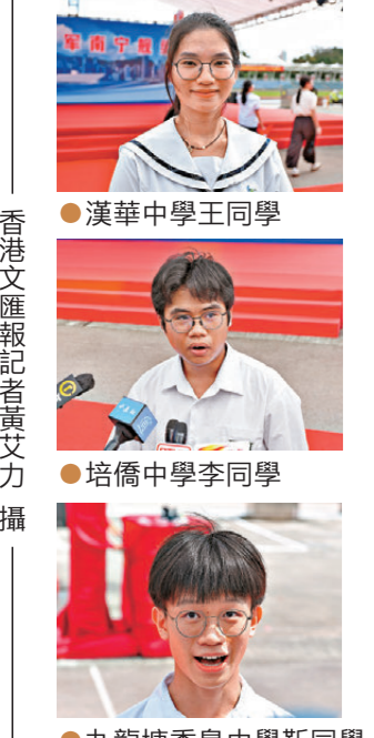
●九龍塘香島中學同學

第三是讓年輕一代感受國防力量強大，厚植愛國情懷。他表示，編隊開放艦艇供市民參觀，為大家提供了親身感受國家軍事力量強大的難得機會，「年輕人通過與官兵互動交流，學習軍人紀律嚴明、堅韌不拔、愛國奉獻的精神，是一堂生動的愛國教育課，必將在年輕一代心中生根發芽，激勵他們未來為中華民族偉大復興貢獻更大力量。」