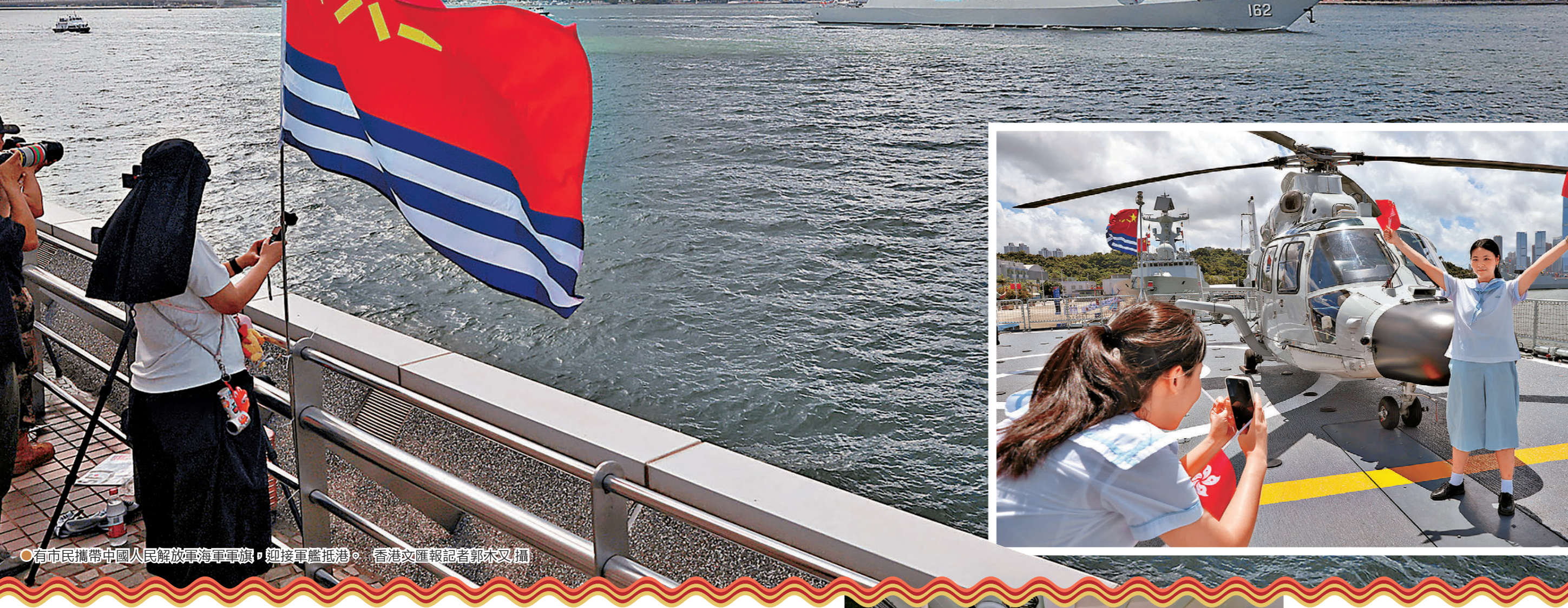
●有市民攜帶中國人民解放軍海軍軍旗，迎接軍艦抵港。

2026年7月 星期五 3 第3519號 今日出版每份40港幣 零售每份27.85 港幣12元 香港文匯報APP