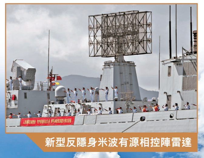
新型反隱身米波有源相控陣雷達